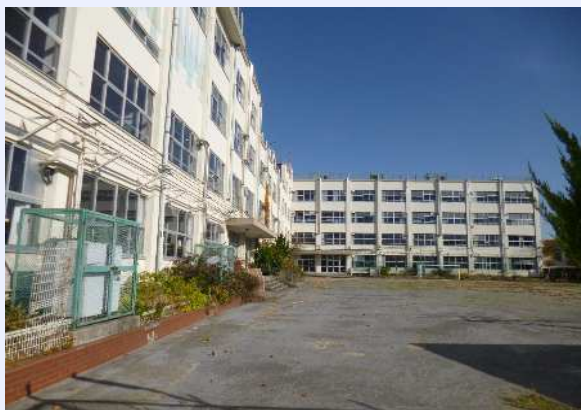
旧新田小学校風景

今回確認された汚染は、建築物やダスト舗装等の下部であるため、汚染土壌の飛散による環境・健康への影響はないと考えています。