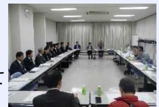
まちづくり連絡会

問い合わせ先: 足立区市街地整備室まちづくり課 電話 03(3880)5259 (直通)