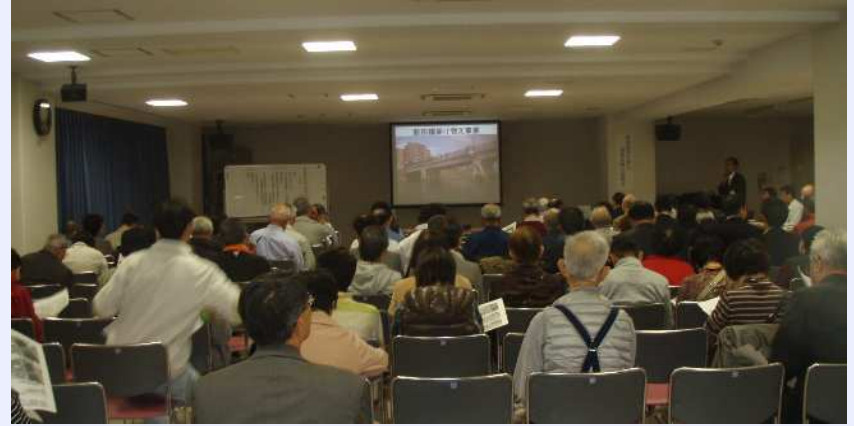
説明会風景(新田学園)

平成24年10月に足立区、北区でそれぞれ事業計画説明会を開催し、橋梁の形式選定・設置高さの決定経緯と仮橋歩道橋案、仮橋車道橋案、上流新橋案の比較検討等を説明しました。