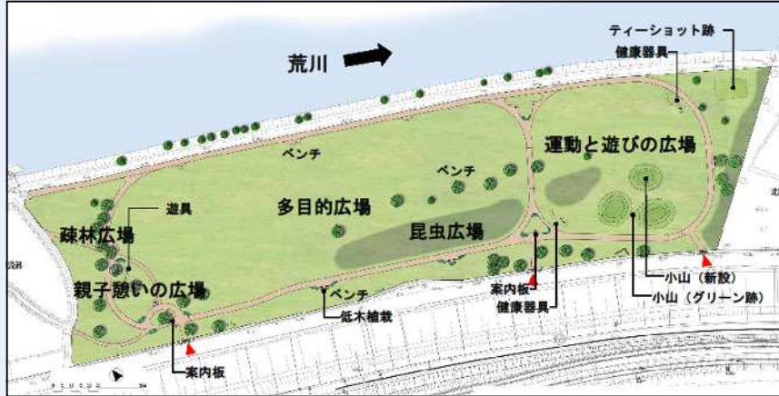
新田わくわく♡ 水辺広場(下流部)

問い合わせ先: 足立区みどりと公園推進室みどり推進課 電話 03(3880)5896 (直通)