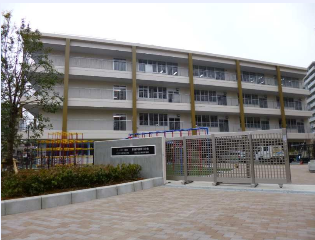
新田学園第二校舎（正門）

平成25年度以降における子どもたちの学び舎となる新田学園第二校舎の建設が進み、平成25年4月に予定通り開校します。