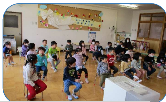
年長組として初めての大会、入園を祝う日での祝いの言葉もみんなで考えました。