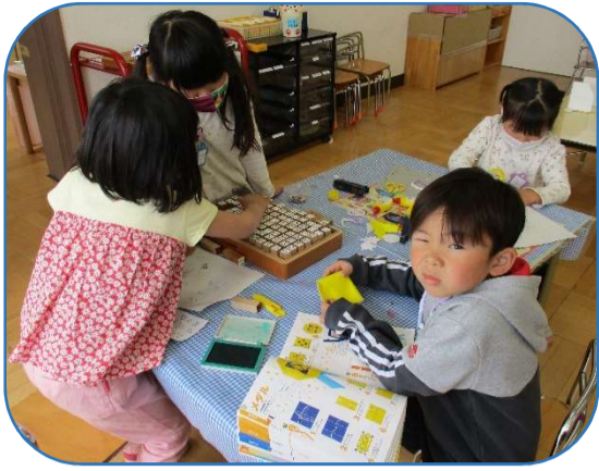
ひらがなスタンプを使って自分の名前やお手紙づくりを楽しんでいます。一文字探すごとに全集中しています。

年長児としての意識も芽生え様々なことに意欲をもち取り組んでいます。子どもたちの意欲は日に日に大きくなっています。