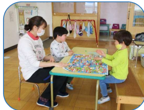
すぐろくも保育者と一緒に始めると、あっという間に遊べるようになりました。すぐに自分たちで遊べるようになっていきました。