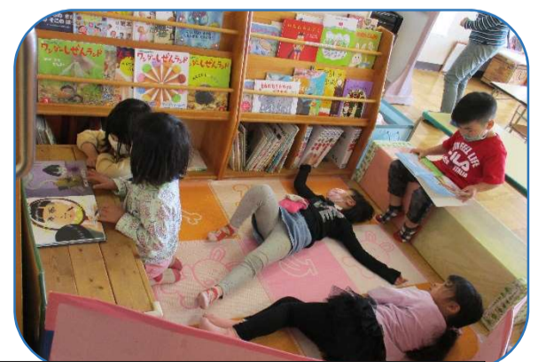
年長組として精いっぱい頑張る子どもたちですが、時にはゴロゴロ大の字にもなりたくなります。