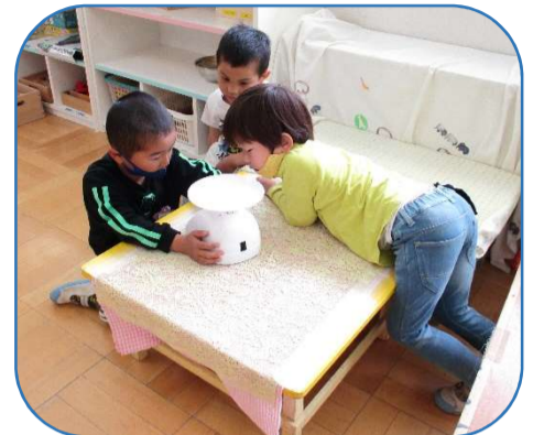
ハカりに興味津々です。なんで物を乗せるとハカリの針が揺れるのか手で押したり、ビースの量を調節したりしながら試していました。