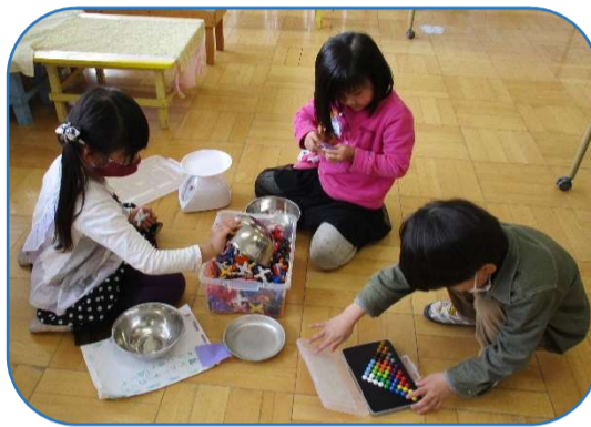
複雑な形のブロックを同期見合わせたら固定できるか試行錯誤してはイメージ通りの形にしようとしていました。人形の形やサイコロにしてみました。