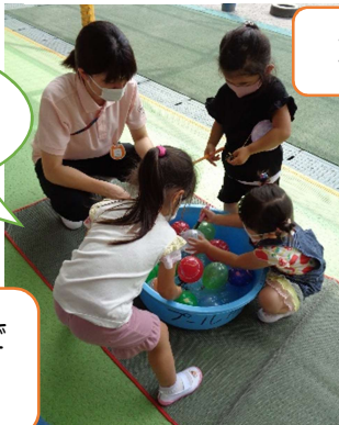
ヨーヨーつり・さかなつり