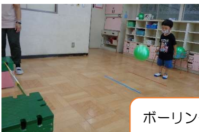
ボーリング 「えいっ!!」