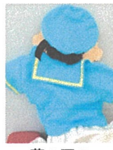
夢の国のあひるさん