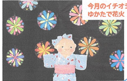
今月のイチオシ ゆかたで花火