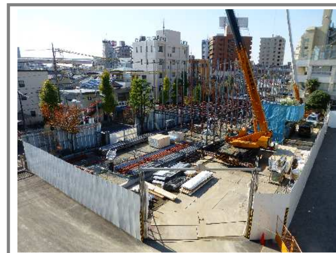
鉄骨の組み始め(11/14の状況)