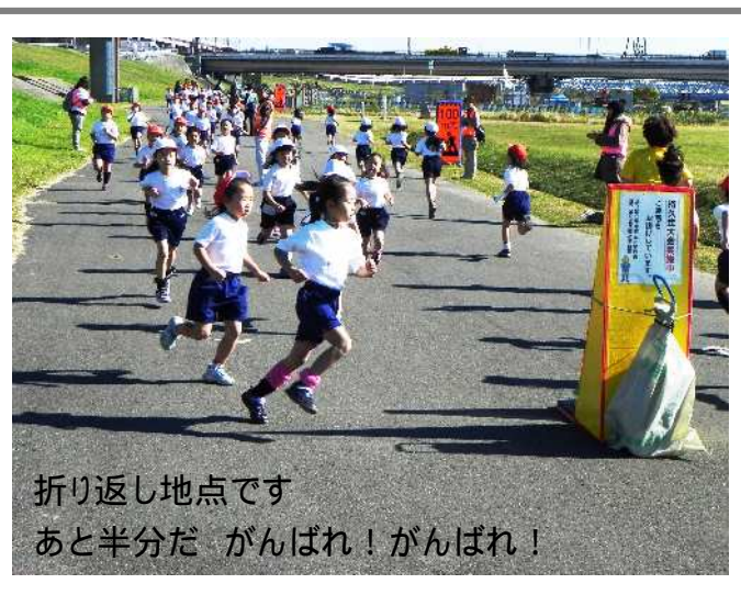
折り返し地点です あと半分だ がんばれ!がんばれ!

1～2年生は800m(400m折り返し) 3～4年生は1000m(500m折り返し) 5～6年生は1500m(750m折り返し) 弱視学級は1000m(500m折り返し) ひまわり学級の児童は、それぞれ同学年の児童と一緒に元気に走り切りました。 さすがに高学年は、とても速かったです。 低学年の子ども達も、自分の力を出し切りました。