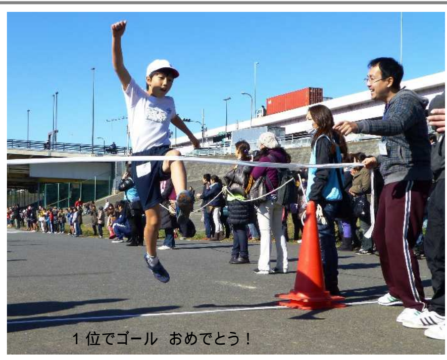
1位でゴール おめでとう!