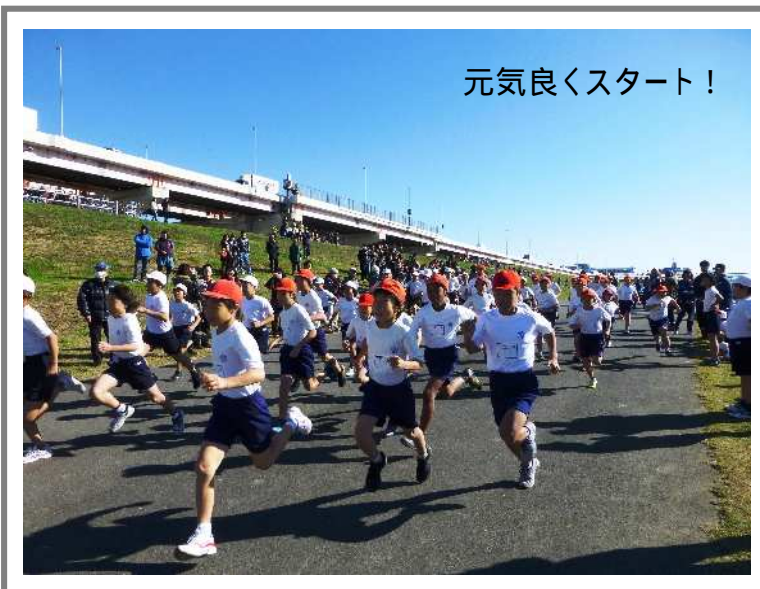
元気よくスタート!

各学年の男女ごとに、両校の児童が西新井橋方面に向かって、元気よくスタートを切りました。