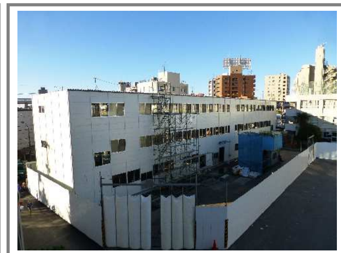
増築新校舎全体(11/27の状況)

第3回足立区議会定例会で、学校の設置条例の改正が議決されました。この条例改正で、統合に向けた大きな手続きが完了したことになります。これまでの関係者のみなさまのご理解とご協力に、あらためて深く感謝申し上げます。