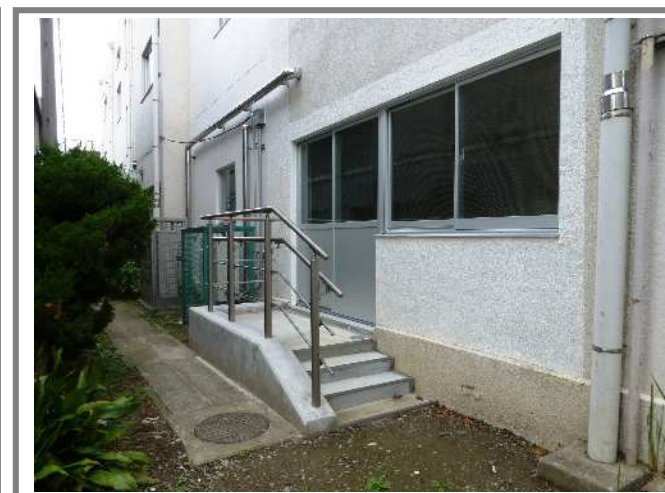
新設した西側の「避難用階段」