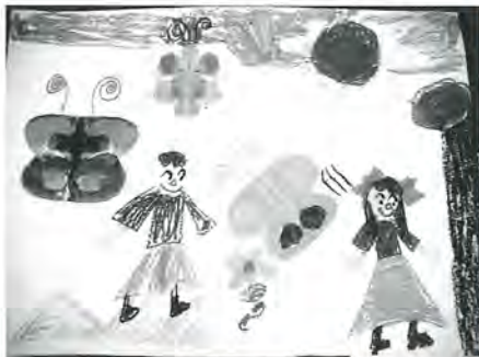
千寿第五小 藤島美穂 1年 作