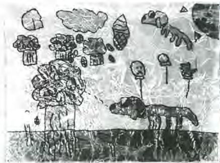
五反野小 3年 佐々木 有里 作