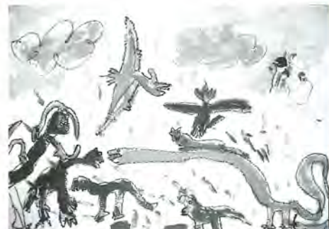
東綾瀬小 百本亮馬 2年 作