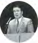
しのはら区議会議長

8月23日、西新井文化ホールにおいて全員研修会が開催されました。さくら色のユニホームに身を包んだ千寿桜小学校の児童の皆