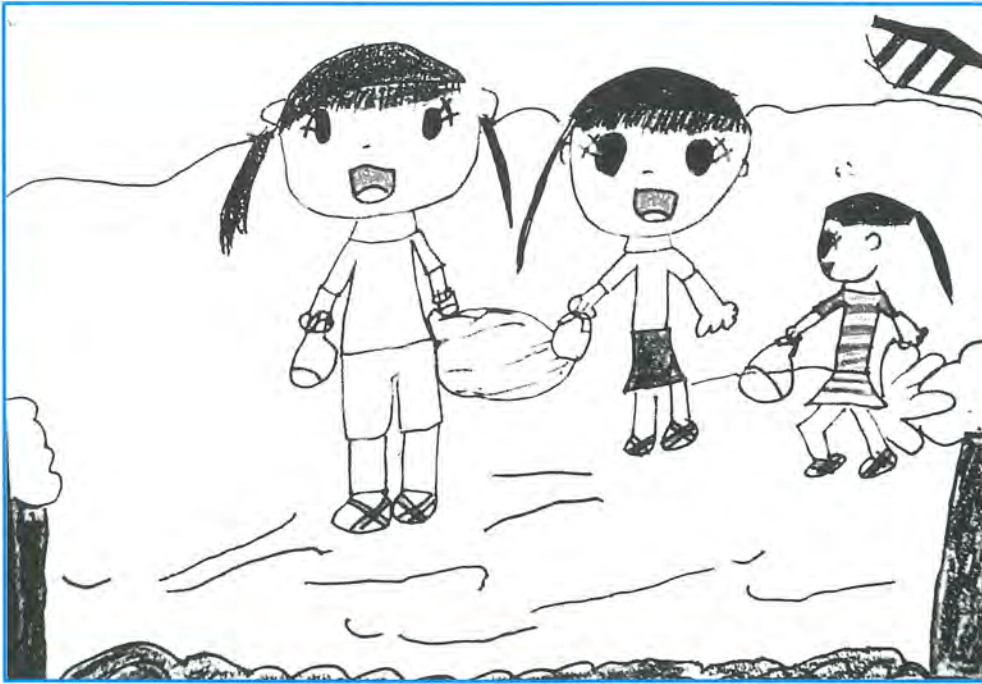
水あそび 綾瀬小2年 室伏めい 作

足立区民生・児童委員協議会 会 長 中田貢弘 編 集 広報部会 発行日 2006年11月1日 〒120-8510 足立区中央本町 1-17-1