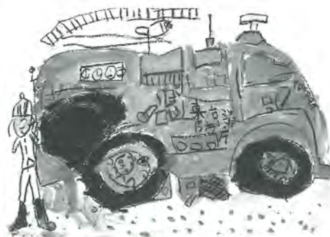
北三谷小 2年 高橋麻起 作