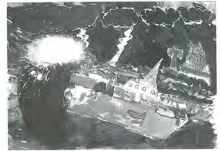
梅島小2年 月原 耀 作