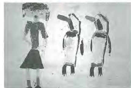
亀田小2年 黒川恵留真 作