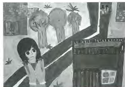
梅島第一小6年 井上佳奈子 作