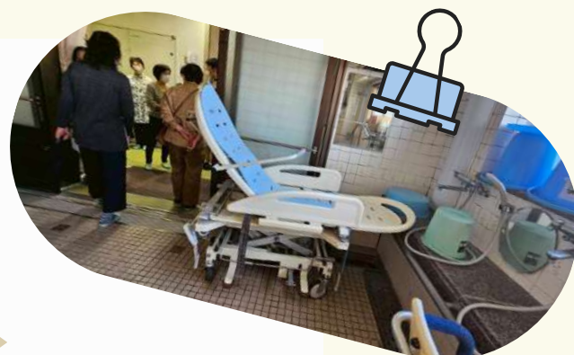
写真（区内高齢者施設を見学）