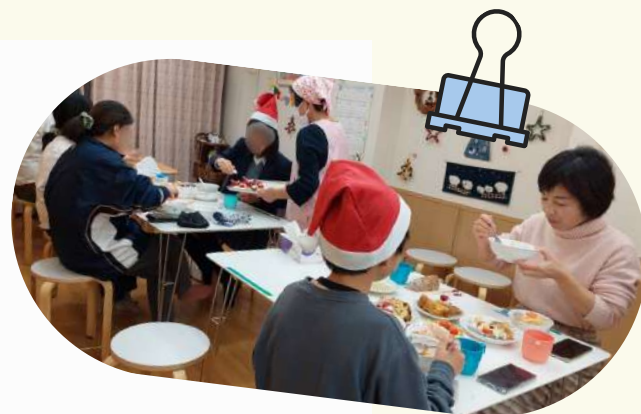
写真（こども食堂で開催した クリスマス会）