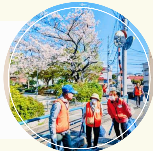
写真（にこにこファミリーによる挨拶活動）