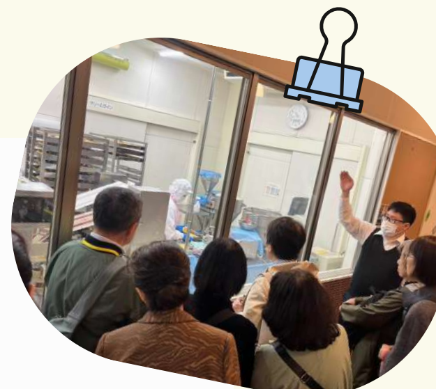
写真（「八天堂きさらづ」にて障がい者雇用について学ぶ様子）