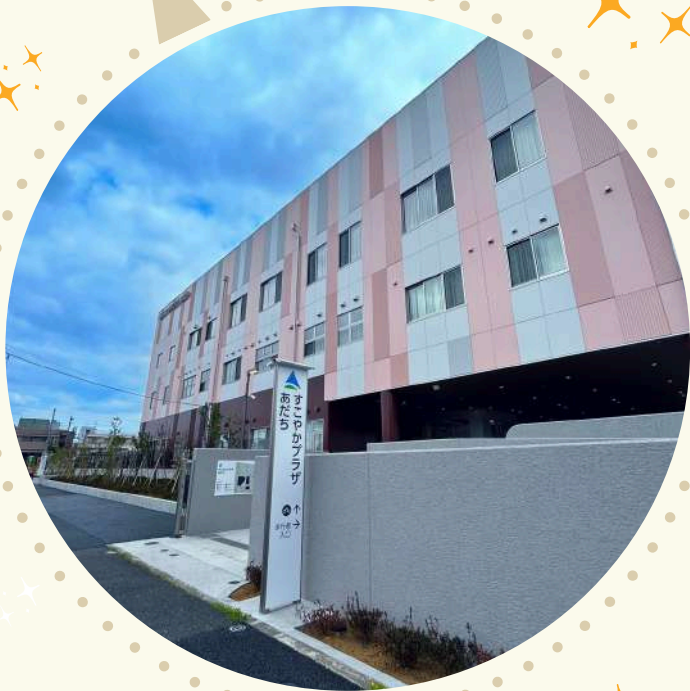
写真（すこやかプラザあだち）