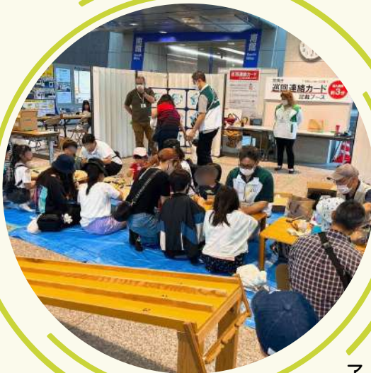
子どもたちと木工カー作り