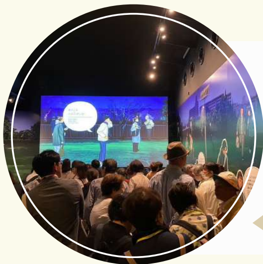
写真（「そなエリア東京」にて災害発生 時の対応を学ぶ様子）

11地区は、足立区内の、真ん中あたりを担当地区として活動させて頂いています。歴史のある地域でもあり、昔からお住まいの方達や、新しい方達が、混在している事もあり、地域の課題は多いですが、皆様が安心、安全に住み続ける事に、少しでもお力になればと、担当委員は、日々頑張っています。応援を頂ければ幸いです。