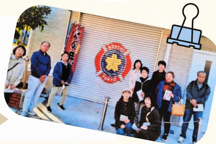
写真（災害用具点検活動）