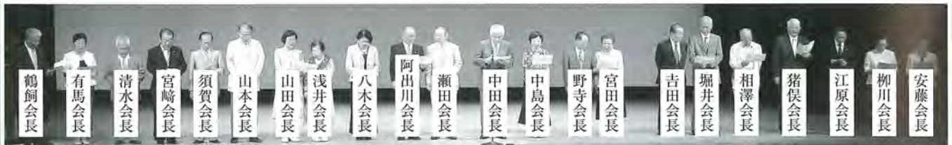
▲「花咲く郷土」を歌う各地区会長