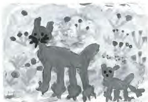
大谷田小2年 冷牟田菜々葉 作