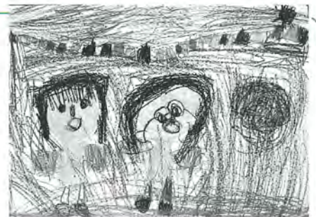
東洲江小3年 庄子侑希 作