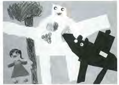
千寿第八小1年 鴨川莉瑚 作

身寄りのないことの危険、それに地域としてどのように立ち向かって行けば良いのか。そのためには行政の縦割りの業務範囲を超え、区民や企業との協働を最大限取り入れた新しい発想の取り組みが必要となっています。(足立区福祉部中部福祉事務所 記)