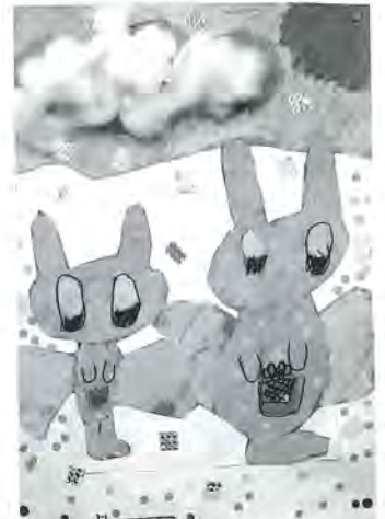
長門小3年 宅石彩乃 作