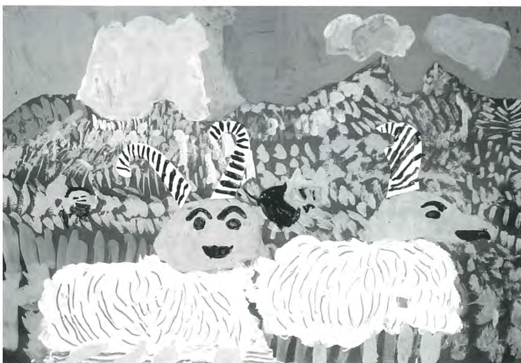
千寿小5年 リー海渡 作

発行 足立区民生・児童委員協議会 連合会長 中田貢弘 編集 広報部会 発行日 2003年7月1日 〒120-0851 足立区中央本町1-17-1