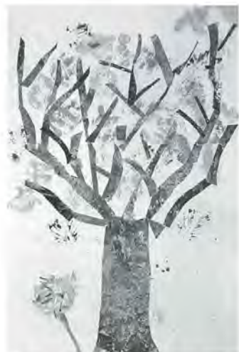
中川北小5年 入澤加奈 作