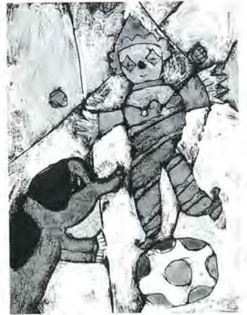
千寿小5年 飯島亜依 作