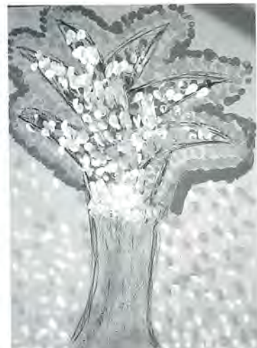
千三小3年 さぎあゆか 作