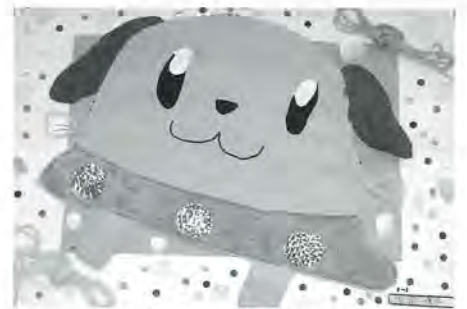
長門小3年 浅沼咲子 作