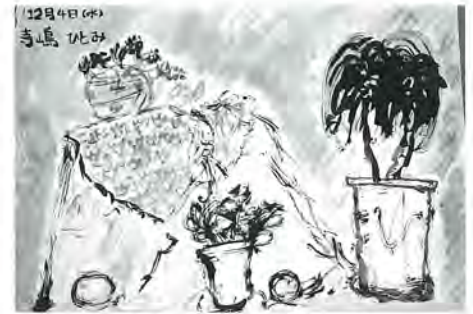
中川北小6年 寺嶋瞳 作