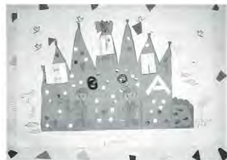
長門小2年 みずしままどか 作