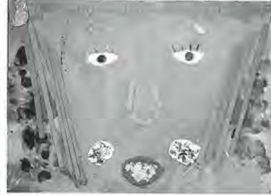
梅島第一小3年 甲斐由梨果 作