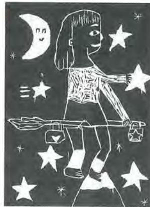
弥生小5年 藤田紗季 作

1,617人。昨年1年間に北部福祉事務所へ相談に訪れた人の数です。この数は年々増加しており、現在の厳しい社会状況の反映と、福祉事務所が地域に認知され、頼りにされていることの現われであると感じています。相談は失業・傷病等の明確な原因による経済的な困窮から家庭内暴力、多額の借金による逃亡等内容がより複雑に多岐にわたっています。しかし、その中でも若い