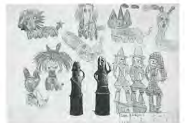
亀田小2年 三上あかね 作