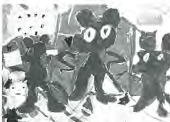
亀田小4年 石橋敦隆 作