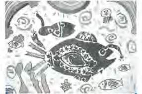
湖江小 3年 稲葉美樹