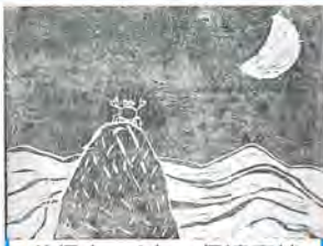
花保小 4年 伊達真純

少子高齢化が叫ばれるなか、誰もがいつでも気軽に参加できる新しいコミュニティとして、地域住民が自らの手で企画運営する梅島・梅田地域総合型クラブ「U&U」が平成15年に結成されました。現在、梅島小学校を拠点に幼児から高齢