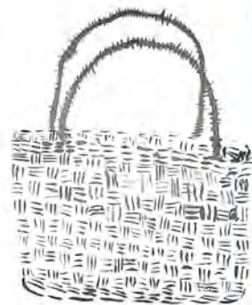
東洲江小 6年 谷森あゆむ 作