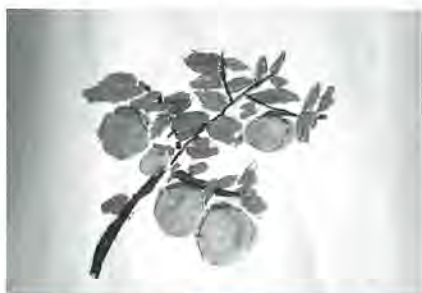
千寿常東小 5年 成瀬勝巳 作