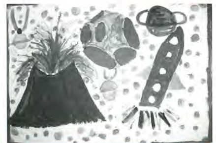
千寿常東小 5年 鈴木百恵 作