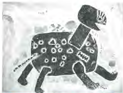
千寿第八小 1年 岸本奈歩 作