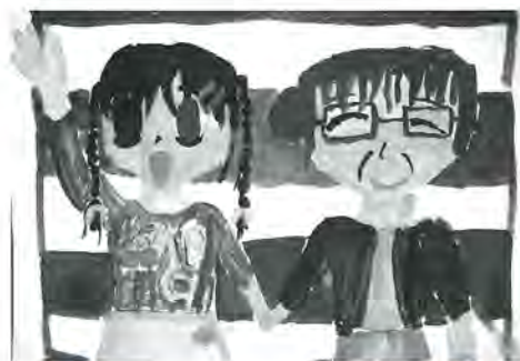
大谷田小 4年 大庭愛美 作