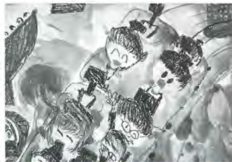
千寿本町小 3年 吉田彩香 作