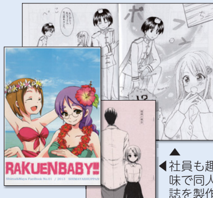
▲社員も趣味で同人誌を製作