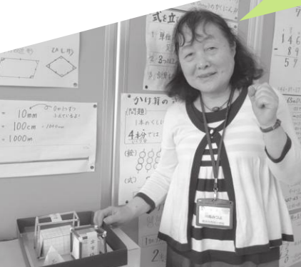
自作した教具やイラストを教室中に置いたり、貼ったりしています。

自作の教具を用いることで、視覚化して理解を深められるように指導しています。また、ゲーム感覚で反復練習を行い、知識の定着を図っています。個別指導を経て、子どもたちが自信をつけ、クラスで積極的に発言をするようになったと聞いたときは嬉しく、やりがいを感じました。ご家庭でお子さんが質問してきたときこそチャンス。丁寧に向き合ってください。