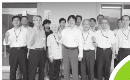
教員の授業力向上に日々尽力する教科指導専門員

休み時間に授業のアドバイスをさせていただき、自信を持って、教えることができました。