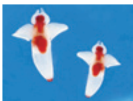
▲左右のひれを手のようにして泳ぐクリオネの様子を見てください

日2月1日～3月31日 ※休園日を除く 内流水の下に生息し、貝殻を持たない巻き貝の一種「クリオネ」を展示