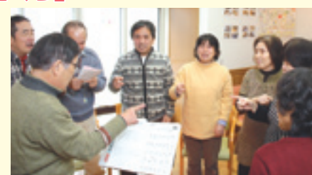
▲歌のプログラムで合唱する通所者

問い合わせ日時=火・木曜日、午前10時～午後3時 ※相談は淵脇さんが在館時のみ可能。見学は要問い合わせ