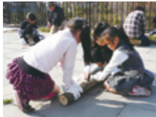
▲打ち込んだホダ木は公園内で育成します