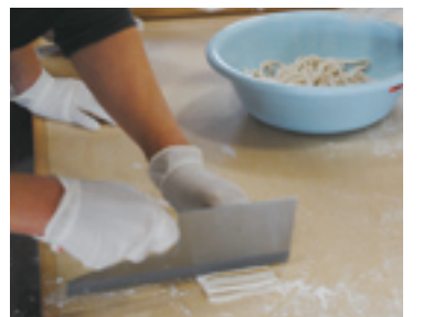
▲自分で打ったうどんはどのような味がするでしょうか?

※場所は都市農業公園内 申▷ハーブミニ講座・植物観察会・園芸教室…不要 ※当日直接会場へ ▷その他…往復ハガキまたはEメール(携帯メール不可)で希望者全員の住所、氏名(フリガナ)、年齢、電話番号、教室名(ハーブ教室は希望時間も)を連絡 ※往復ハガキは返信面にも宛名を記入。同じ教室の重複申し込み不可 問都市農業公園 〒123-0864鹿浜2-44-1 ☎3853-4114 ✉toshinou@city.adachi.tokyo.jp