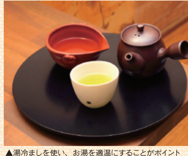
▶湯冷ましを使い、お湯を適温にすることがポイント

日時=6月17日(日) 午前10時30分~11時30分 場所=茶匠おくむら園(関原3-15-1) 対象=小学生と保護者 持ち物=500mlの空のペットボトル 定員=6組(12人、5月28日から先着順) 費用=1組300円 申し込み方法=電話 申込・問い合わせ先=中央本町保健総合センター保健栄養担当 ☎3880-5355