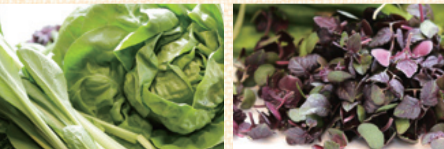
▶新鮮な足立区産野菜。小松菜とサラダ菜、しその芽

野菜は新鮮であるほど栄養が豊富です。水菜、レタス、かいわれだいこん、サラダ菜、しその芽、ペビーリーフなどのとれたての足立区産野菜を使えば、栄養を逃しません。