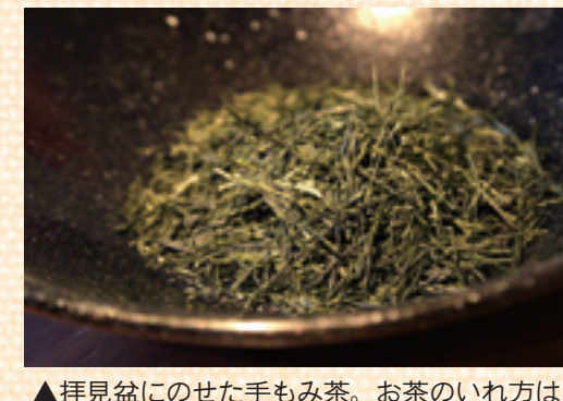
▶拝見盆にのせた手もみ茶。お茶のいれ方は人により異なるので自分の好みに合う茶葉を探すのも楽しい

日時=6月16日(日) 午前10時30分~正午 午後2時~3時30分 場所=エル・ソフィア 対象=4歳~小学3年生と保護者 定員=各20組(5月28日から先着順) 費用=子ども1人200円(材料費) 申し込み方法=電話 日時=6月15日(金) 午前10時30分~正午 場所=区役所庁舎ホール 対象=1歳~就学前の子と保護者 内容=食にまつわる歌や親子体操など ※運動できる服装で参加 定員=200人(5月28日から先着順) 費用=無料 申し込み方法=電話 日時=6月16日(日) 午前10時30分~正午 午後2時~3時30分 場所=エル・ソフィア 対象=4歳~小学3年生と保護者 定員=各20組(5月28日から先着順) 費用=子ども1人200円(材料費) 申し込み方法=電話 日時=6月30日(土) 午前9時30分~11時30分 場所=北足立市場(入谷6-3-1) 対象=小学3~6年生と保護者 定員=12組(6月1日から先着順) 費用=1組500円(材料費) 申し込み方法=電話 日時=6月30日(土) 午前9時30分~11時30分 場所=北足立市場(入谷6-3-1) 対象=小学3~6年生と保護者 定員=12組(6月1日から先着順) 費用=1組500円(材料費) 申し込み方法=電話 日時=6月30日(土) 午前9時30分~11時30分 場所=北足立市場(入谷6-3-1) 対象=小学3~6年生と保護者 定員=12組(6月1日から先着順) 費用=1組500円(材料費) 申し込み方法=電話