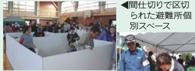
▲間仕切りで区切られた避難所個別スペース