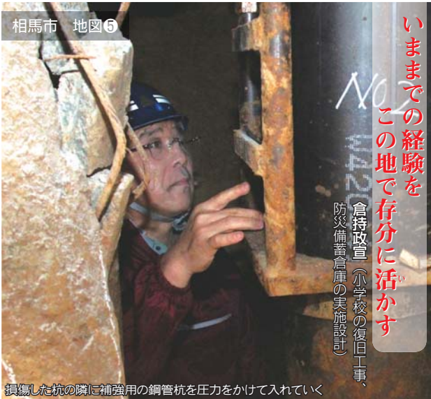
損傷した杭の隣に補強用の鋼管杭を圧力をかけて入れていく

校舎直下の限られた空間が仕事場 美しい田園風景の中にある大野小学校。同校の校舎はそれを支える地中の杭が複数損傷し、傾倒してしまっ