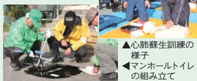
▲心肺蘇生訓練の様子 ▲マンホールトイレの組み立て

実際に体験してみると... 昨年11月13日に、区内18カ所の避難所で総合防災訓練が行われました。参加者からは「トイレなどの場所を初めて確認した」「地域のつながりの強さを再認識した」といった意見がある一方、「体育館の避難所(個別スペース)の狭さに驚いた」という声も。やはり、実際に参加してこそ分かることは多く、皆さん、「訓練は継続が大切」と口々に話していました。まずは「知る」が防災対策の第一歩。防災訓練に参加しましょう。