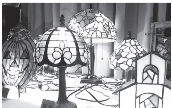
▲様々な作品展示も魅力