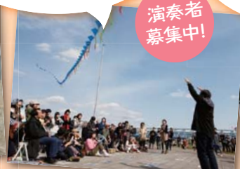
▲「空飛ぶオーケストラ大実験」@虹の広場