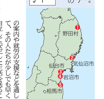
野田村 ① 気仙沼市 ② 岩沼市 ③ 仙台市 ④ 相馬市

未曾有の被害をもたらした東日本大震災。区では被災地を支援するために、4月から7人の職員を派遣している。彼らから被災地の現状と現地での任務について聞いた。