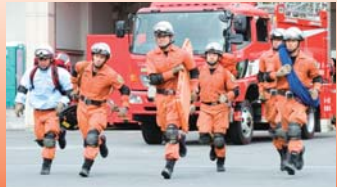
▲特別な技術と能力を備えた部隊でも日々の訓練は欠かせない

昨年の大震災では、福島第一原子力発電所三号機の使用済み核燃料プールへの放水作業を行いました。燃料プールの水が減り核燃料が露出して、大量の放射線と放射性物質が放出されるのを防ぐためです。当時、われわれの部隊のメンバーは全員出動しました。