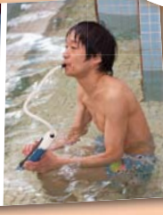
※写真はすべて昨年度のもの