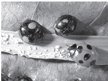
▲一緒に探しに行きましょう

日9月2日(日) 午後1時30分~2時30分 ※午前9時30分から受け付け開始 内様々な種類のテントウムシが大集合 定20人(先着順) ※就学前の子どもは保護者同伴