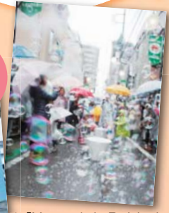
▲「Memorial Rebirth 千住いろは通り」

この下は広告スペースです。内容については各広告主にお問い合わせください。広告掲載のお問い合わせは、報道広報課へ ☎3880-5815