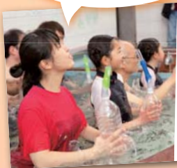
▲「風呂フェッショナルなコンサート」@タカラ湯