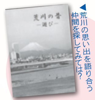
「荒川の昔一遊び」荒川の昔を伝える会編集(荒川ピシターセンター)