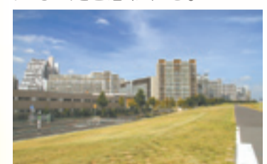
▲現在の新田の風景

著者は足立区出身。作中で主人公が勤める工場のある地域は新田地域がモデルになったと思われる。