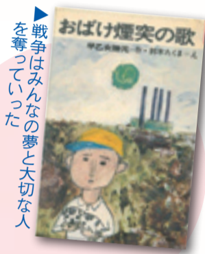
「おばけ煙突の歌」早乙女勝元著(理論社)

日時=10月21日(日) 午後1時30分~2時30分 対象=小学3年生以上の方 内容=足立区出身の作家で東京大空襲の語り部として名高い早乙女氏による講演会 定員=80人(9月26日から先着順) 費用=無料 申し込み方法=電話または窓口 場所・申込・問い合わせ先=新田コミュニティ図書館 ☎3912-1767