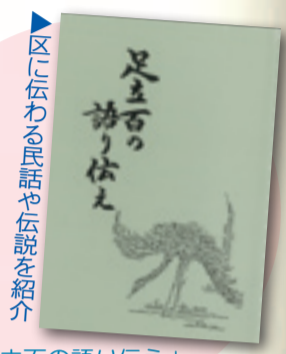
「足立の語り伝え」加藤敬夫編(足立区教育委員会)

日時=10月5日(金) 午後2時~3時30分 内容=虎斑稲荷(とらふいなり)/くもの糸/おこんじょうり/あらしのよるになどの朗読 費用=無料 申し込み方法=不要 ※当日直接会場へ 場所・問い合わせ先=伊興図書館 ☎3857-6537