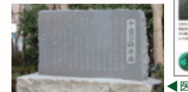
▲医院跡に建てられた千住の鷗外碑

森鷗外の父が千住で医師として開業していたことから鷗外も一時千住に住んでいた。そのころのまちの様子がうかがえる。