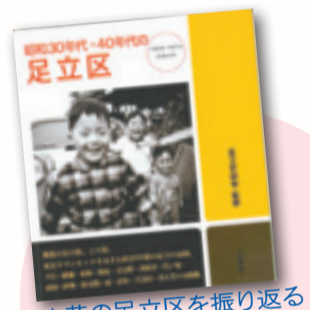
「昔の足立区を振り返ると、素晴らしい俳句が思いつくかも」

募集期間=10月1日~12月27日 対象=高校生以上の方 内容=足立区の自慢の事柄を入れた俳句を募集。応募作品の中から区長賞・優秀賞・佳作を決定し、受賞者には図書カードを贈呈 費用=無料 申し込み方法=応募用紙を提出 応募用紙配布場所・申込・問い合わせ先=鹿浜図書館 ☎3857-6551