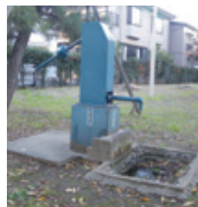
▲災害緊急トイレや非飲料水を供給できるように防災井戸を設置

を設置します。設置する公園は、区内全域かつ第一次避難所に近く、また 帰宅困難者対策 としても有効な主要道路に近い場所とします。