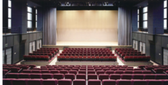
▲千住にある東京芸術センター最上階(21階)の多目的ホール。創造力を自由に表現できます