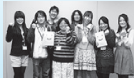
▲実行委員の皆さん。記念品のステンレスサーモボトルとビューフの手提げ袋（試作品）を手にして

ることをやっていきたいです。私たちががんばっていけば、それが将来の子どもたちに伝わり、良い循環になると思います。足立区は、さまざまな年代の人たちが接し合える温かい雰囲気があるまちなので、それを誇りに思い、区外の人たちにも知ってもらえるようになることを願っています。