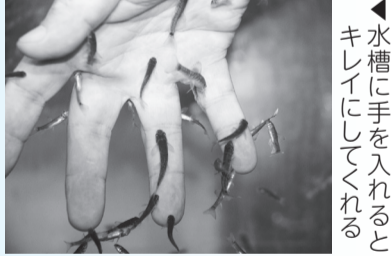
▲水槽に手を入れるとキレイにしてくれる

■日時=開催中~2月1日、午前10時30分~正午/午後1時30分~3時 ■内容=肌の古い角質を除去してくれる小魚(ガラ・ルファ)の体験 ■申込=不要 ※当日直接会場へ