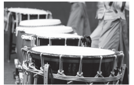
▲和太鼓という伝統楽器に、若いメンバーたちが新たな命を吹き込む

だと聞いています。最初に和太鼓の演奏を見たときは、「太鼓でこんなことができるんだ」と驚きましたし、今は「太鼓で何でもできる」とその可能性に大きな魅力を感じています。太鼓の魅力をたくさんの方に伝えられるように、皆さんと楽しい時間を共有したい。そんな想いで活動しています。