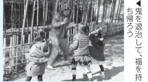
▲鬼を退治して、福を持ち帰ろう

■日時=2月1日(日)、午前10時30分~正午 ※午前10時受け付け開始 ■場所=古民家 ■定員=20人(先着順) ■費用=100円