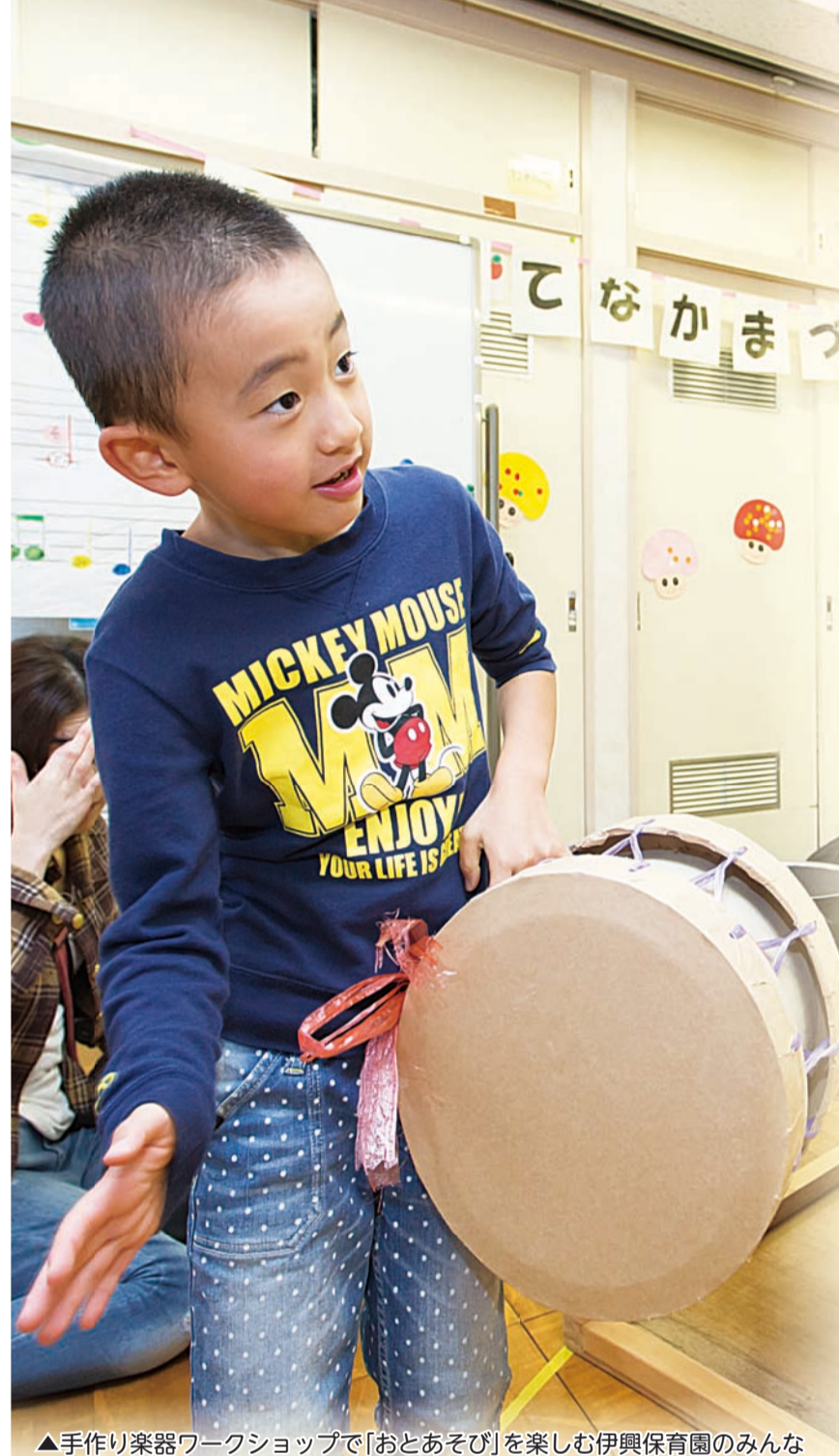
▲手作り楽器ワークショップで「おとあそび」を楽しむ伊興保育園のみんな