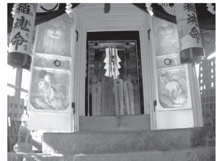
▲年に3日間だけ開帳される「伊豆の長八」鏝絵