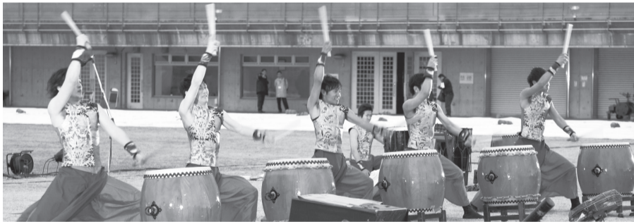
▲春の花火と千本桜まつりでの力強い演奏

和太鼓は古くから日本で使われてきた楽器ですが、複数の太鼓を舞台上で演奏するような形態は、戦後に始まった比較的新しいもの