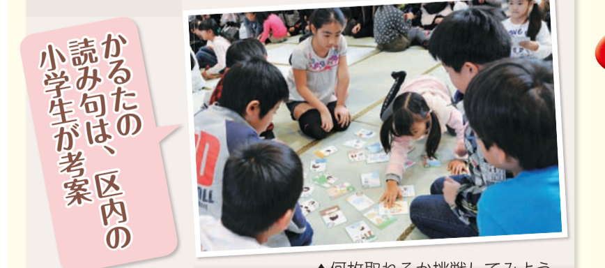
▲何枚取れるか挑戦してみよう

「あだち環境かるた2」は、楽しみながら環境問題を学ぶことができます。今年のお正月は「あだち環境かるた2」で盛り上がりましょう。 問800円 ※区政情報課で販売。区のホームページからもダウンロード可 問環境学習係 ☎3880-6263