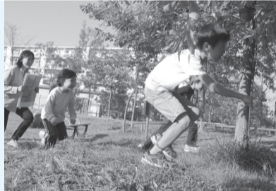
▲頭と体を動かして、自然を楽しもう

■日時=2月1日(日)、午後2時~3時 ※午後1時45分受け付け開始 ■内容=自然に関するゲームやクイズをしながら、園内を探検する ■定員=20人(先着順) ※就学前の子どもは保護者の参加が必要