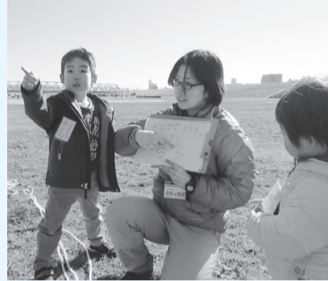
▲冬の荒川で自由に遊ぼう

■日時=1月18日(日)、午前10時~11時30分 ※午前9時から荒川ビジターセンターで参加証配布 ■場所=荒川河川敷 ■対象=就学前の子どもと家族 ■内容=荒川河川敷で体を動かしたり、野草を使った工作をしたりして遊ぶ