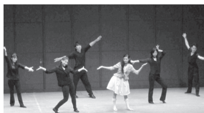
▲不思議な動きで魅了するパントマイム

■日時=1月31日(土)、午後2時開演 ※午後1時開場 ■内容=劇団東京人形夜若手会によるパントマイムとダンス