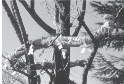
▲地域の無病息災を祈るためのわらで作られた大蛇

~11時 ■場所=大乘院(西保木間2-14-5) ■内容=区指定民俗文化財の「じんがんなわ」を見学し、魔よけのわら蛇作りに参加