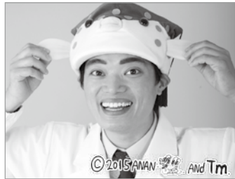
東京海洋大学名誉博士 さかなクンから環境を学ぶ

■申先=環境政策課 環境事業係 ■申・問先=お問い合わせコール あだち(毎日、午前8時~午後8時) ☎3880-0039