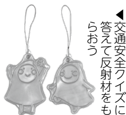
交通安全反射材をもらおう

■日時=5月11日～20日、午前8時30分～午後9時50分 ※土・日曜日は午前9時～午後9時50分。20日は午後3時まで ■場所=区役所1階区民ロビー ■内容=交通安全に関するパネル展示/ビュー坊反射材プレゼントクイズ(15日(金)、午後2時開始。1人1個まで。なくなり次第終了) ■申込=不要 ※当日直接会場へ