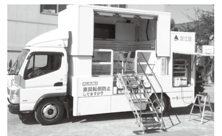
▲地震体験車「震太くん」。昨年度は1万5,000人以上が体験した。イベントなどでも運行予定

■内容=震度7までの揺れが体験できる地震体験車を、事業所などで行う防災訓練に出張 ※煙体験訓練も併せて受け付け可 ■受け付け開始日=訓練日の6カ月前 ※申し込み方法など、くわしくはお問い合わせください。 ■問先=災害対策係 ☎3880-5836