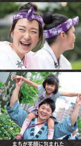
まちが笑顔に包まれた