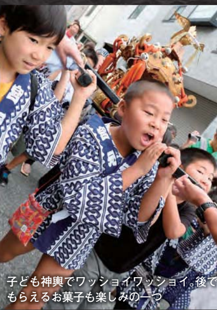
子ども神輿でワッショイワッショイ、後でもらえるお菓子が楽しみ

をとげた。その千住で、今年6つの神社が大祭を祝い、その内4つが集中した9月13日。早朝から老若男女の「セイヤー」の掛け声に合わせ、神輿が上へと踊り始めた。江戸時代から受け継がれたさらびやかな神輿が、一斉に練り歩くと、観客を巻き込み、まちはたちまち熱気にあふれた。神輿の担ぎ手は、町会・自治会ごとに異なる半纏を身にまとう。その数は千住全域で約40種。同じ色や柄の半纏が一斉に神輿を取り巻く様子は祭の華を思わせる。「小さな地域で一斉に祭をやるもんだから、結果として千住が一体となって、まちに絆が生まれるんだ」とある担ぎ手は言う。人情と絆を後世に伝えようとする人々の思い。その思いが人々を繋ぎ、千住のまちが「祭」で一つになる。