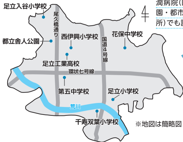
図1 当日参加できる防災訓練場所一覧

■時間等=▷区内7カ所の学校(第一次避難所)…午前中 ▷都立舎人公園…午前10時～午後2時 ■場所=図1 ■内容=避難所の開設訓練や初期消火、応急救護などの防災訓練 ※参加者には記念品を贈呈。都立舎人公園では、関係機関による防災普及啓発など、体験しながら災害への備えを学ぶ特別プログラムを実施 ■申込=不要 ※当日直接会場へ。集合時間など、くわしくは区のホームページをご覧ください。