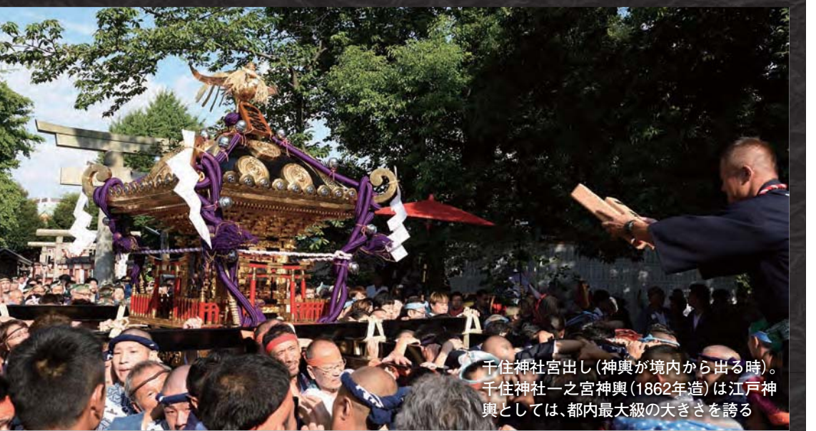
千住神社宮出し(神輿が境内から出る時)。千住神社一之宮神輿(1862年造)は江戸神輿としては、都内最大級の大きさを誇る