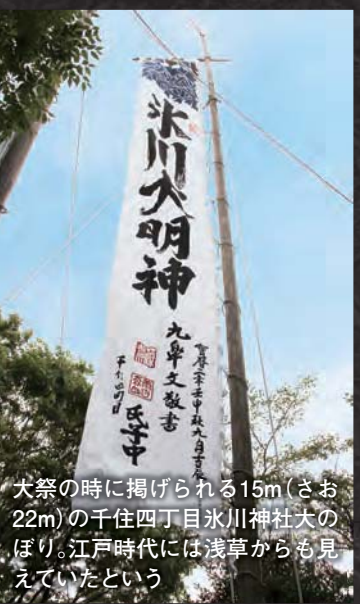
大祭の時に掲げられる15m(さお22m)の千住四丁目氷川神社大のぼり。江戸時代には浅草からも見えていたという