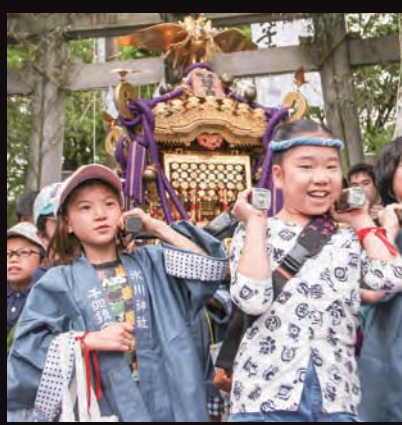
祭当日、多くの子どもたちも参加した

「子どもたちに地域の伝統や祭の魅力を感じてもらい、一人でも多く祭に参加してほしい」。その思いから、千住本町五町会連合の若手有志では、千寿本町小学校の4年生を対象に、祭の出前授業を行っている。祭の歴史とともに、神輿の担ぎ方など、用意されたまちの神輿に触れながら学ぶことができる。こうした取り組みは区内でも珍しく、児童たちは目を輝かせて祭を体験した。まちの姿は変わっても、祭の伝統は後世へ脈々と受け継がれていくのだ。