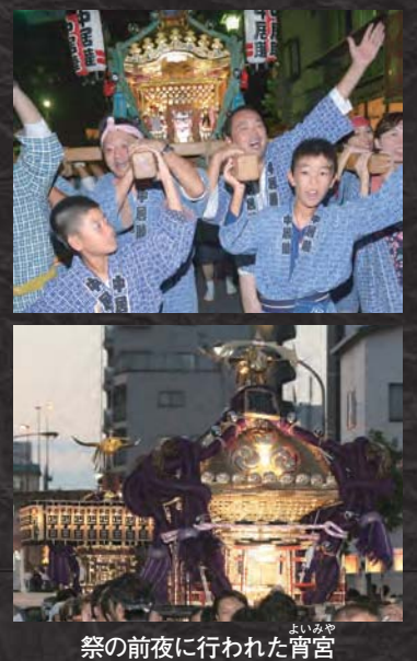
祭の前夜に行われた宵宮