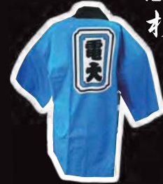
背中に「電大」が入った東京電機大学の学生専用の半纏