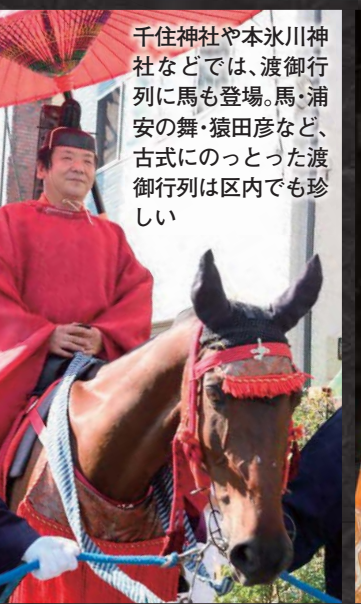
千住神社や本氷川神社などでは、渡御行列に馬も登場。馬・浦安の舞・猿田彦など、古式にのっとった渡御行列は区内でも珍しい