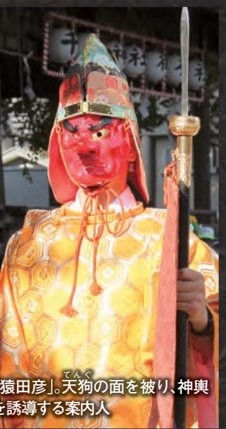
「猿田彦」。天狗の面を被り、神輿を誘導する案内人