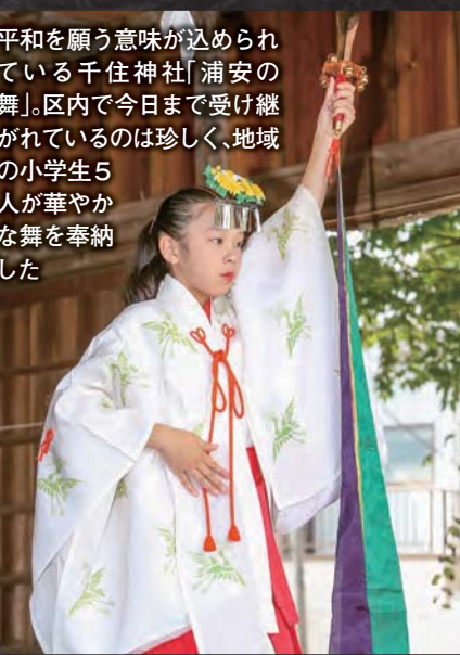
平和を願う意味が込められている千住神社「浦安の舞」。区内で今日まで受け継がれているのは珍しく、地域の小学生5人が華やかな舞を奉納した