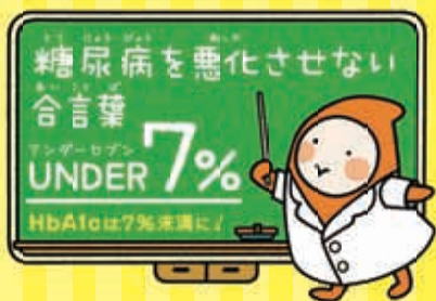
▲あだち糖尿病対策プロジェクトU-7

※かむカムランチを食べてアンケートに答えた方に粗品を呈呈 ※いずれも ■問い合わせ先=健康づくり係 ☎3880-5433