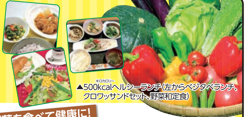
▲500kcalヘルシーランチ(左からベジタベランチ、クロワッサンドセット、野菜和定食)

区の糖尿病にかかる治療費は増加傾向にあり、国民健康保険医療費の約4割(約255億円)を占めます。11月は糖尿病予防をはじめ、健康でくらすための様々なイベントを開催します。