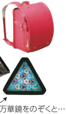
万華鏡をのぞくと...

区内の製造業者による 「夏休み足立ものづくり体験」も同期間に開催。 7月10日号で紹介予定