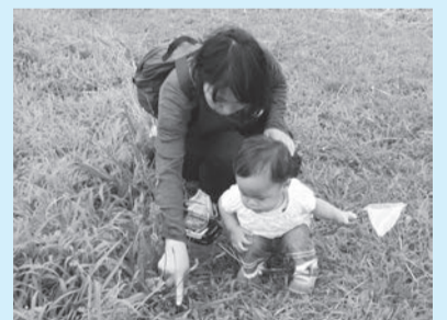
▲バッタとりに挑戦!

■日時=7月8日(日)、午前10時30分～11時30分 ■対象=就学前の子どもと保護者 ■内容=スタッフと一緒にバッタを探して触れ合う ※保護者向けに「生き物ものしりシート」あり ■定員=20人(抽選) ■申込=窓口または全員の住所・氏名(フリガナ)・年齢・電話番号・ファクス番号、「家族で探そうバッタ」をファクス・往復ハガキで送付 ※往復ハガキは返信面にも宛名を記入。1人1回のみ申し込み可 ■期限=6月26日(火)必着