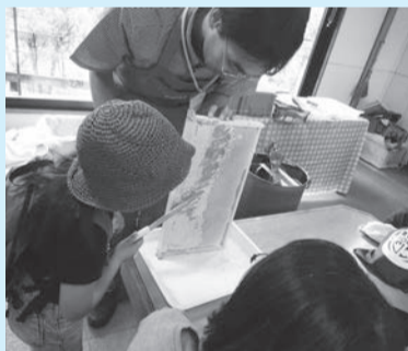
▲ミツバチが集めたはちみつがたっぷり!

■日時=6月17日(日)、午前10時～正午/午後1時30分～3時30分 ■場所=人と自然の共生館 ■内容=ミツバチの巣箱を観察し、はちみつしぼりを体験する ※都市農業公園産はちみつのお土産あり ■定員=各20人(抽選) ■費用=1,500円(材料費) ■期限=6月7日(木)必着