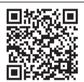
▲A-メールの登録はコチラから

熱中症情報などをA-メール(足立区メール配信サービス。要事前登録)の「夏の重要なお