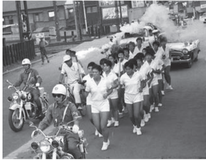
▲1964年足立区を快走する聖火ランナー

区では東京2020オリンピック・パラリンピック開催の2年前(7月24日)に合わせ、前回の東京オリンピック(1964年)で実際に区で使われた聖火トーチを、当時の写真や聖火ランナーの思い出と共に「パネル展示」で紹介します(予定)。トーチをお持ちで区の展示にご協力いただける方はご連絡ください。