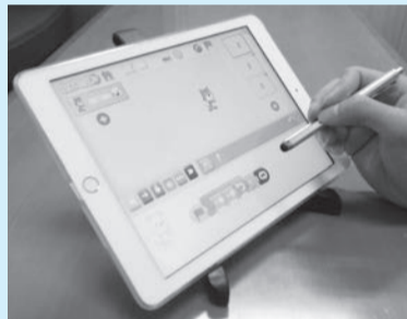
▲プログラミングをしてキャラクターを動かしてみよう

■日時=6月8日(金)、午後2時30分～4時30分 ※時間内随時受け付け ■対象=5歳～小学生 ※就学前の子どもは保護者同伴 ■内容=タブレット端末を使ったプログラミング講座 ■申込=不要 ※当日直接会場へ