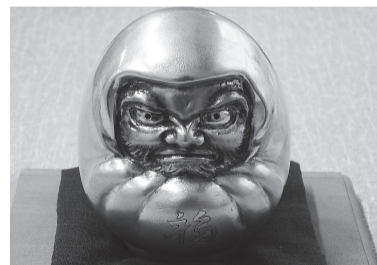
▲銀器のだるま(常設展示)