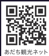
あだち観光ネット

西新井駅は、急行・準急などが停車します。 お帰りの際は、比較的混雑の少ない西新井駅の利用がおすすめです。