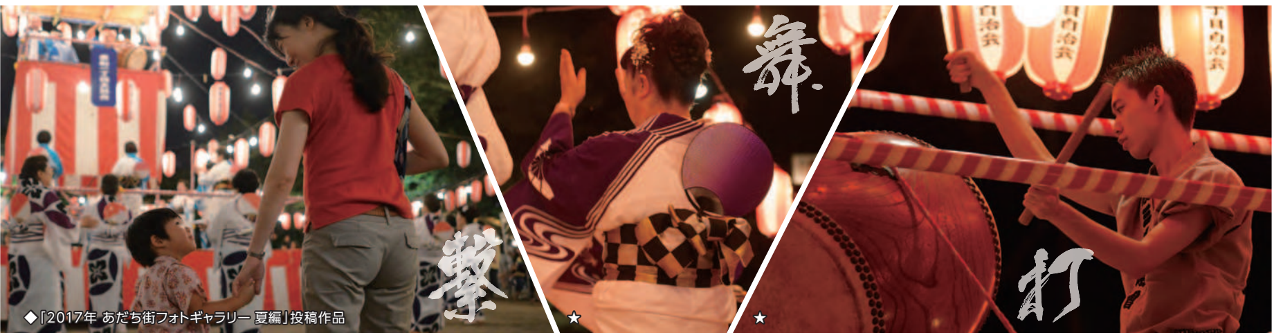
◆「2017年 あだち街フォトギャラリー 夏編」投稿作品