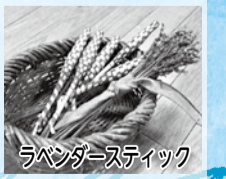
ラベンダースティック

■日時=6月23日(日)、午前10時30分~正午 ■対象=小学生以上の方(小学3年生以下の方は保護者同伴) ■内容=園内のラベンダーを使って、香りを楽しむクラフト(スティック、香り袋など)を作る ■定員=18人(抽選) ■費用=600円(材料費など) ■申込=全員の住所・氏名(フリガナ)・年齢(学年)・電話番号、「ラベンダークラフト」を往復ハガキで送付 ※返信面にも宛名を記入。1人1回のみ申し込み可 ■期限=6月12日(水)必着