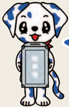
足立区選挙PRキャラクター「エラビ」