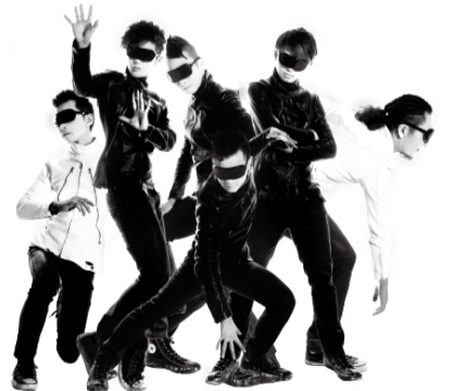
▲この日限りの足立区特別版を披露!

■日時=6月9日(日)、午後4時開演 ※午後3時30分開場 ■場所=シアター1010・11階劇場 ■対象=区内在住・在勤・在学の方 ■内容=パフォーマー集団「SIRO-A」による、ダンスとプロジェクションマッピングを融合させた近未来型のスペシャルパフォーマンス ■定員=500人(抽選) ■申込=代表者の住所、全員の氏名(フリガナ)、会社名または学校名(区外在住の方のみ)、「日本文化再発見」を往復ハガキで送付 ※返信面にも宛名を記入。1通で4人まで。1人1回のみ申し込み可 ■期限=5月20日(月)消印有効 ■申・問先=「SIRO-A LIVE事務局」(シアター1010内) 〒120-0034千住3-92 ☎5244-1011