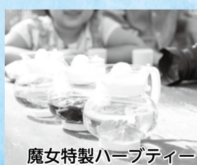
魔女特製ハーブティー