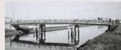
▲平成3(1991)年まで桑袋大橋付近に架かっていた木造橋は「蛇橋」と呼ばれていた