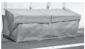
幅180cmまたは120cm ×奥行60cm ×高さ66cm

丈夫なボックスタイプで、カラスや猫がふたを開けることができない/使用しないときは、折り畳んで収納できる