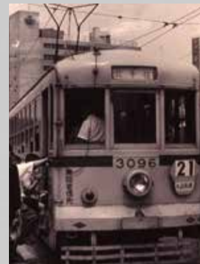
▲昭和43(1968)年までは都電が橋上を駆け抜けていた

現在の鉄橋は昭和2(1927)年に架橋され、日本最古のタイドアーチ橋*としても知られている。*…長大な橋のたわみ発生を予防し、強度を高める工法の一つ