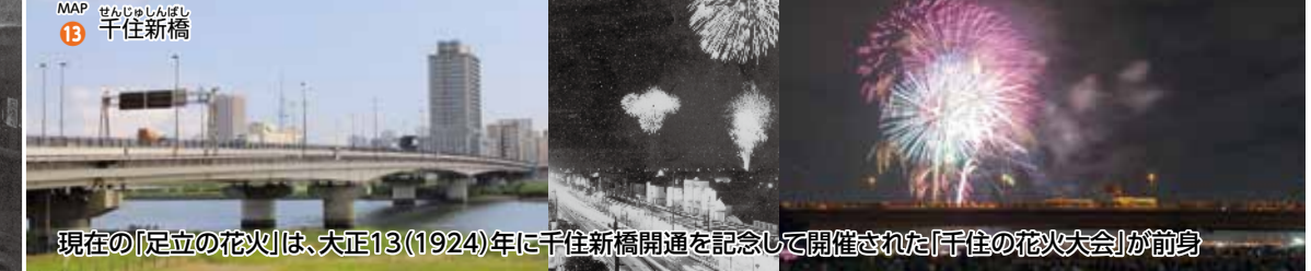
MAP 13 千住新橋 現在の「足立の花火」は、大正13(1924)年に千住新橋開通を記念して開催された「千住の花火大会」が前身