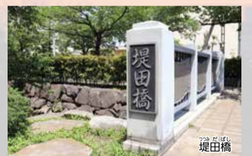
▲「堤田」は昭和7(1932)年まで存在した小学(市区町村内の区画名)