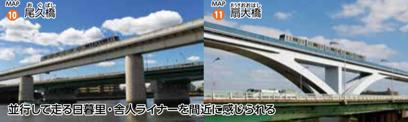
MAP 10 尾久橋 並行して走る目黒里・合人ライナーを間近に感じられる