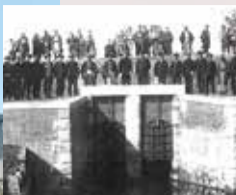
▲橋付近の水門に集まる人々。明治43(1910)年にはすでに架橋されていたとの記録がある