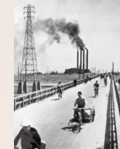
▲初代の橋は、現在の二代目より少し西側に位置していた。後方に見えるのがお化け煙突

*…徳川家直轄領の花畑側に堤防が築かれたことで、たびたび水害に遭っていた対岸の大曾根村(現・八潮市)の名主は、村を救う一心で堤防破壊を画策。しかし襲撃に遭って命を落とし、残された母は「息子や蛇になれ」と叫んで川に身を投げてしまう。その後、川の近くに横たわる大木が突然大蛇のように動き出したことから、「親子が大蛇に化けた」と恐れられた。