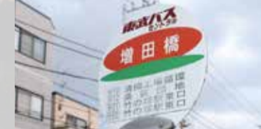
▲増田橋(東武バス停)