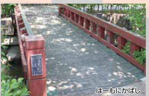
▲ハーモニカを連想させる欄干(手すり)が特徴