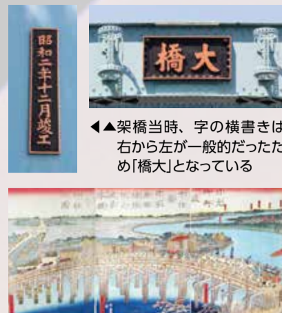
▲架橋当時、字の横書きは右から左が一般的だったため「橋大」となっている