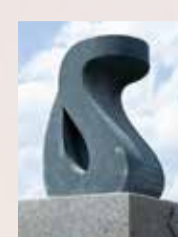
▲モニュメントには蛇腹模様も施されている