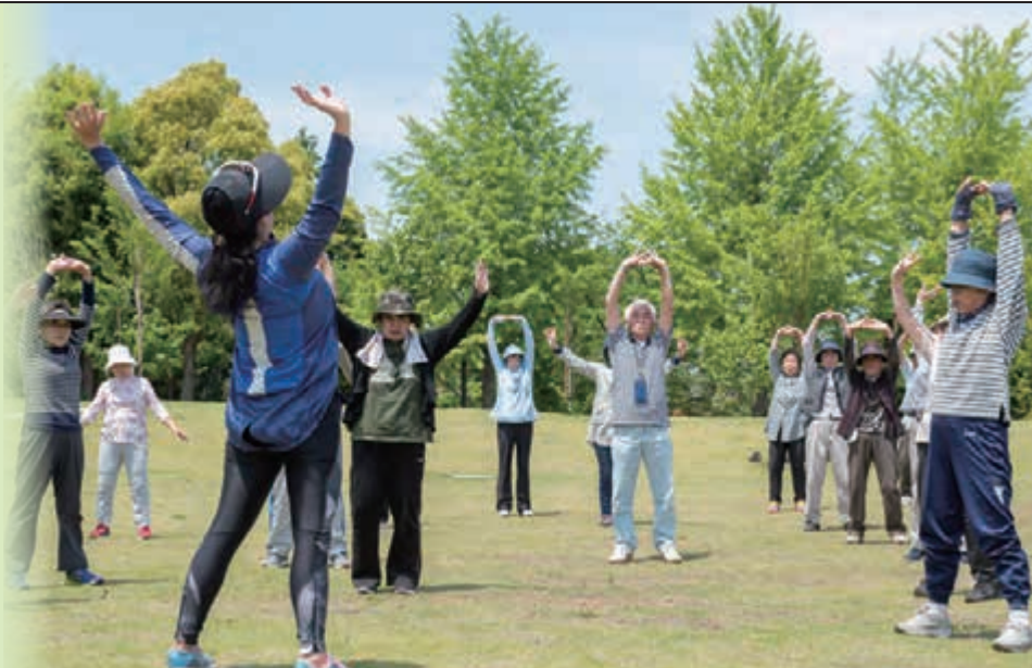
撮影場所: 江北平成公園

費用 無料 申し込み方法 不要 ※当日直接会場へ 問い合わせ先 スポーツ振興課 振興係 ☎3880-5826