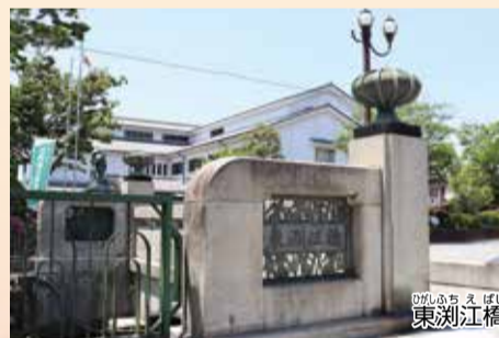
▲昭和7(1932)年まであった東洲江村に由来。平たいタマネギのようなオブジェは「擬宝珠(宝珠を模した装飾)」

ドローンで空撮した区・PR動画「空カラアダチ」にも登場! ※条件を満たせば、素材を自由に利用可能 空カラアダチ 検索