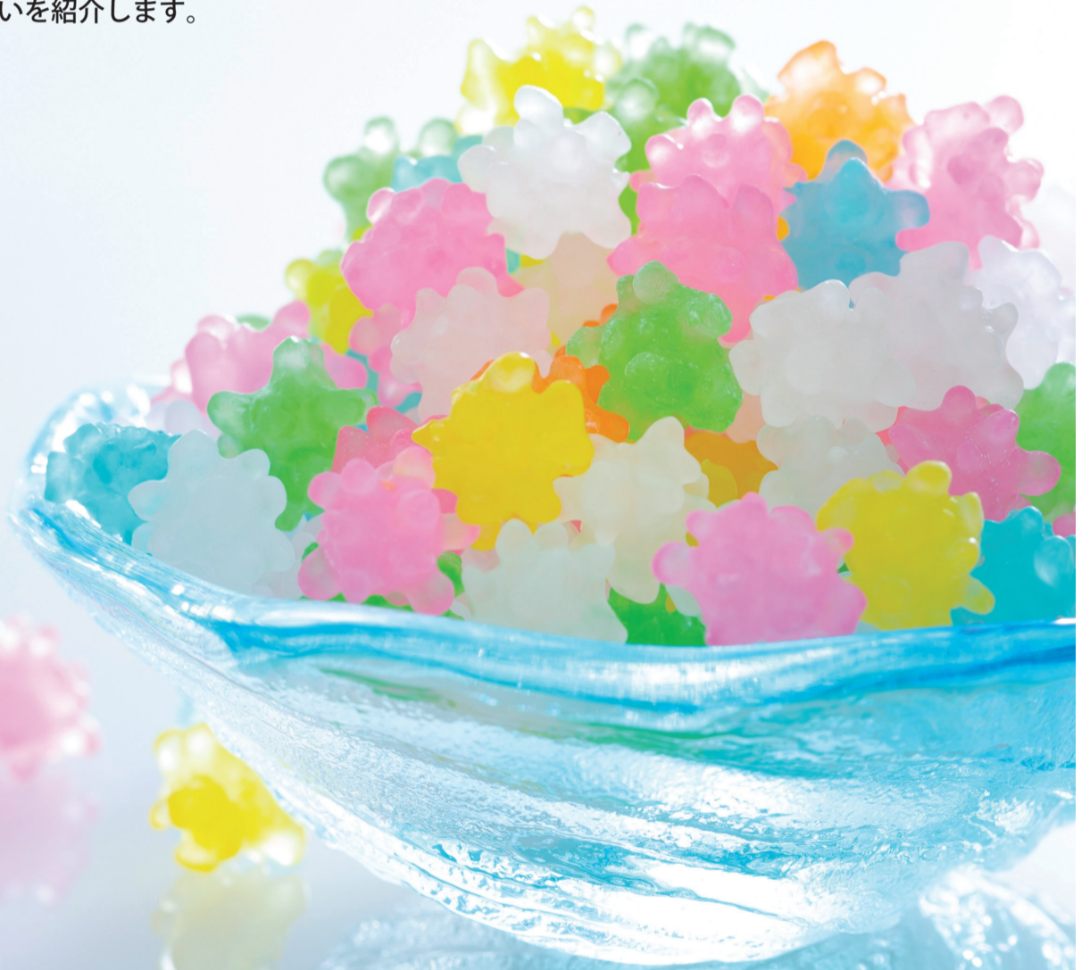
写真 (有)エビス堂製菓「金平糖」

今では珍しい手作り金平糖。2週間に渡って大きな釜を職人がかき混ぜることで、宝石のような輝きが生み出される。味だけでなく、目でも楽しむことができる逸品。