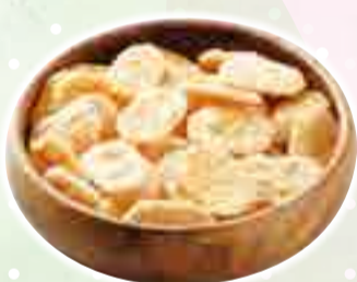
▲(株)山根製菓「うす焼き煎餅」