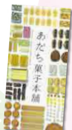
▲あだち菓子本舗 リーフレット