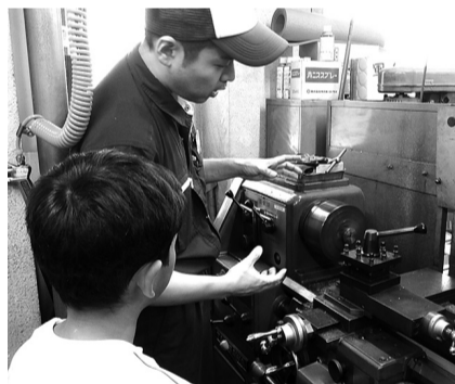
▲現場の雰囲気を感じられる

区内製造業9社の現場を体感するチャンス! プロの仕事を見てみよう! ※実施日時や場所などは工場により異なります。定員など、くわしくは区のホームページをご覧ください。 ■期間=7月29日(月)～8月2日(金) ■申込=区のホームページから専用フォームに入力(先着順)