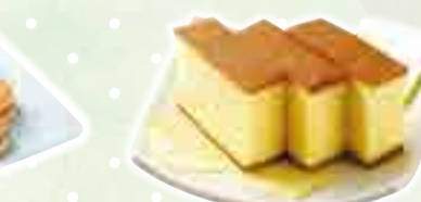
▲(株)柴山製菓 「はちみつカステラ」