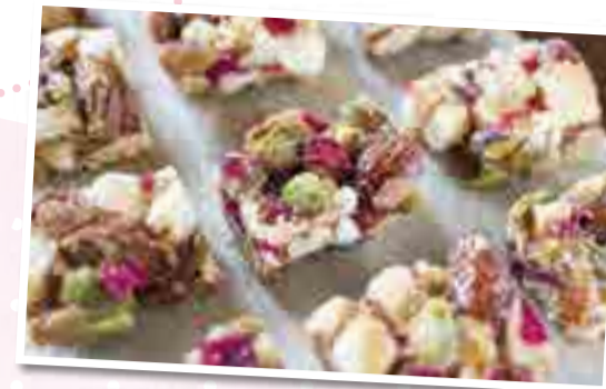
▲CARAMEL ALMOND PRALINE 「伝統にユーモアを」がモットーの(株)篠原製菓。従来の「おこし」にない食材を組み合わせた味、深いお菓子です。