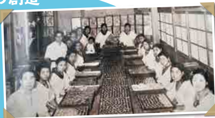
▲昭和10年代の菓子製造の様子