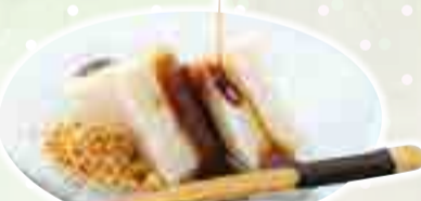
▲(株)ミサワ食品「東京くずもち」