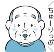
表5 「あだち☆ちゅうりっぷ体操教室」日時等

■日時等=表5 ■内容=口の機能チェック(咀嚼チェックガム、発音測定)/あだち☆ちゅうりっぷ体操体験 など ■定員=各25人(10月28日から先着順) ■申込=電話/窓口