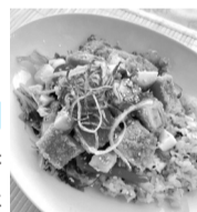
▲1日メニュー「ハワイアンポキごはん」(アメリカ)

■日時=11月の毎週金曜日、午前11時~午後2時 ■場所=区役所地下1階食堂 ■内容=東京2020大会参加国にちなんだヘルシーメニューを週替わりで提供 ※先着各100食