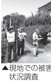
▲現地での被害状況調査

※台風の影響により、鋸南自然の家は現在利用できません。ご迷惑をおかけし申し訳ございません。再開のめどが立ちしだい、お知らせします。 ■問先=自然教室係 ☎3880-5970 台風被害に遭われた皆さまに心よりお見舞い申し上げます。足立区では、災害協定を締結している千葉県鋸南町への支援を行っています。