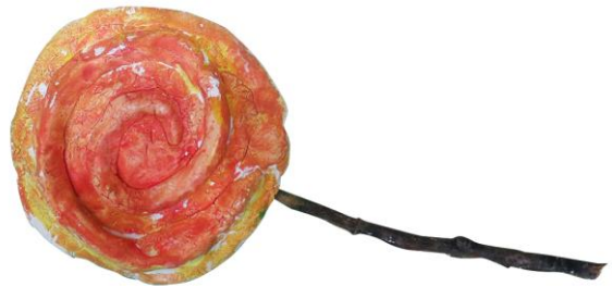
ペロペロキャンディー