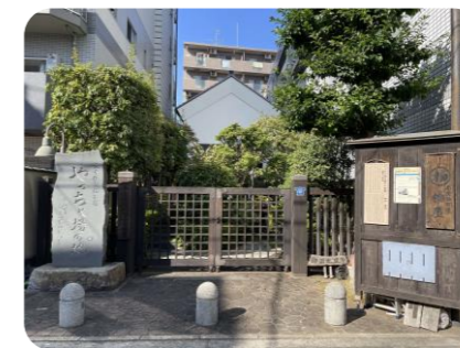
千住宿歴史プチテラス