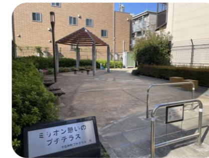
ミリオン憩いのプチテラス