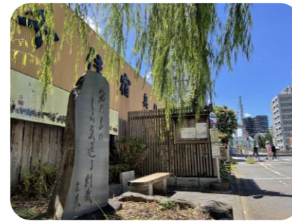
千住奥の細道プチテラス