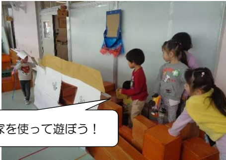
ネズミのお家を使って遊ぼう！