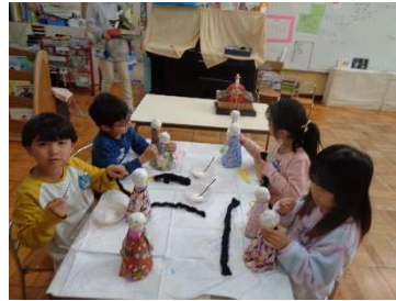
おひなさまの髪の毛、どのくらいの長さにしようかな？

修了まであとわずかとなりました。友達と一緒に遊んだり、活動に取り組んだりする中で、お互いの良い所を認め合い、自信をもって就学に繋げられるように一日一日を大切に過ごしていきたいと思いません。