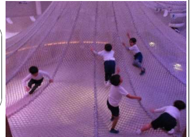
友達や保育者と一緒に鬼ごっこ！