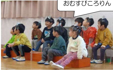
おむすびころりん すっとんとん

そして、4月からはよいよ年長児としての生活が始まります。これまで、自らの成長を実感し、自信につながる経験を積み重ねてきました。期待をもって進級できるように一人一人の思いを丁寧に受け止めていきます。