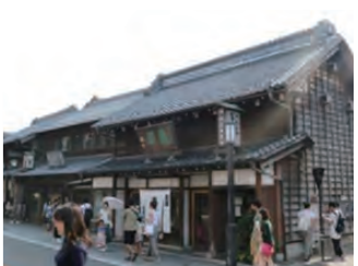
川崎市一番街商店街 (埼玉県川崎市)

くわしくは 景観デザインガイド 【和風の意匠による景観形成事例集】 をご覧ください。 <足立区HPからダウンロードできます>