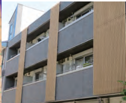
木格子風のルーバーで演出した 共同住宅のベランダ