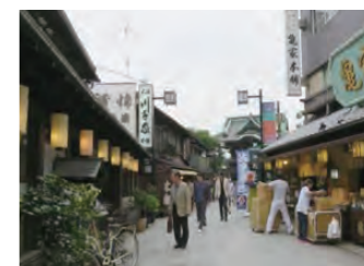
柴又帝釈天参道商店街 (葛飾区)