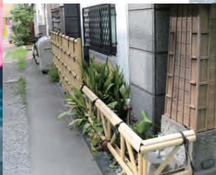
竹垣を組み合わせた 植栽の外構デザイン