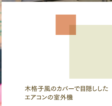
木格子風のカバーで目隠した エアコンの室外機