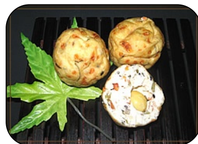
ぎんなん入り京がんも