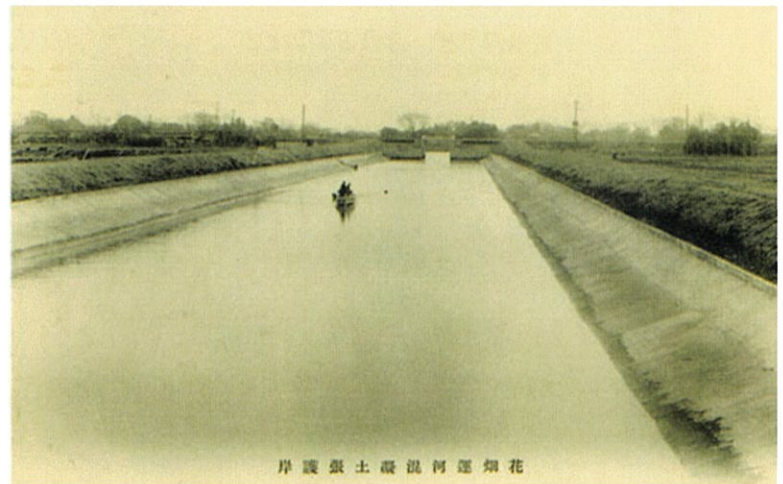
(花畑運河混泥土張護岸 : 足立区郷土博物館蔵)