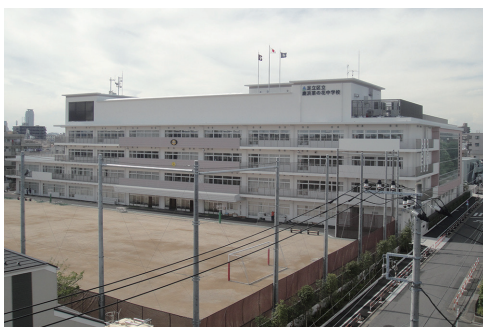
▲鹿浜菜の花中学校校舎