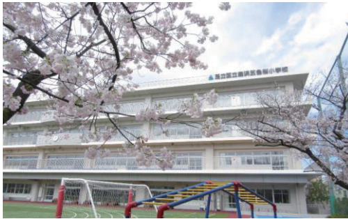
▲鹿浜五色桜小学校校舎

温かい地域の皆様、若々しくエネルギッシュなPTAの皆様、「チーム鹿浜五色桜小」としてお力をいただきながら、目の前にあるどんな困難も乗り越えていきたいと思ひます。