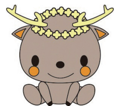
▲鹿浜菜の花中学校公式キャラクター「なのしか」

また学校ホームページのトップページ「校長日記」を平日は毎日更新しています。合わせてご覧いただき、今後とも鹿浜菜の花中学校へのご理解とご協力のほどよろしくお願ひいたします。