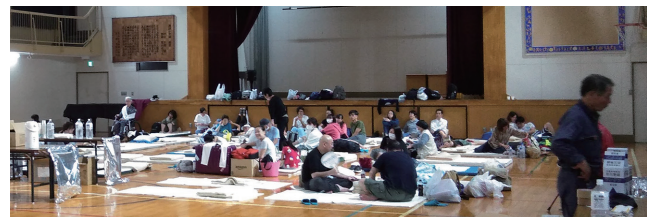
▲台風19号時に開設された血沼小学校避難所

町会・自治会に加入されていない皆様は、町会・自治会を通じたコミュニティや助け合いの重要性をご理解いただき、是非ご加入を検討いただけますようお願いいたします。