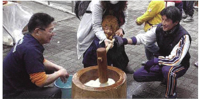
▲江北六丁目団地自治会の餅つき大会