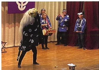
▲皿沼保存会によるお囃子