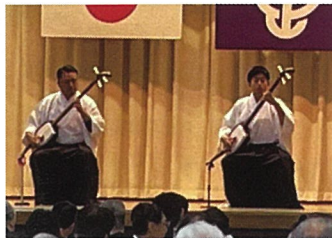
▲あべやの津軽三味線