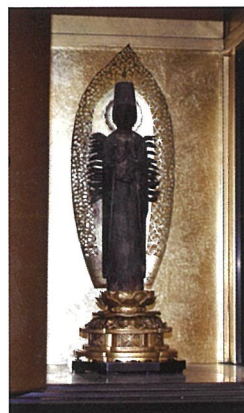
▲千手観音