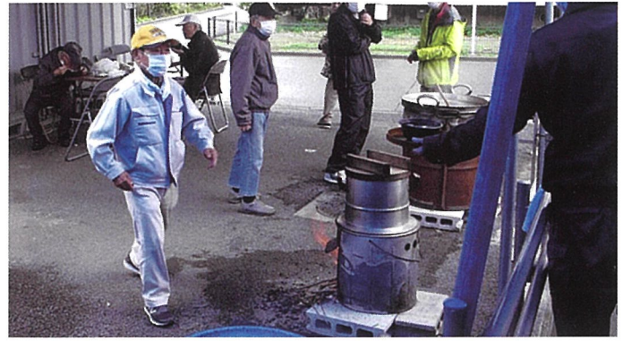
▲鹿浜五丁目団地北部自治会の芋煮会