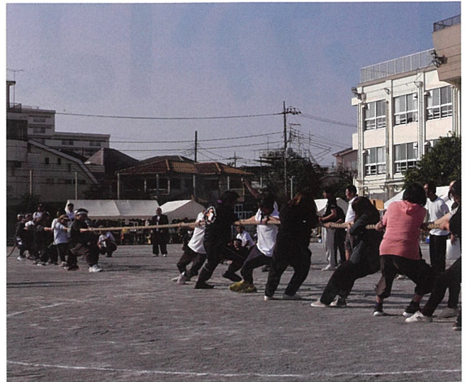
▲それ引け、ワッショイ！日頃の力を見せます……