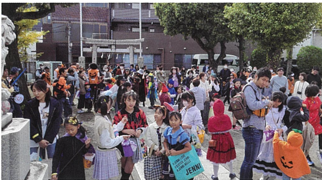
▲ハロウィンパレードに集まった多くの参加者

谷在家町会において平成28年の第1回ハロウィンパレードから、今回で第6回目の実施となりました。