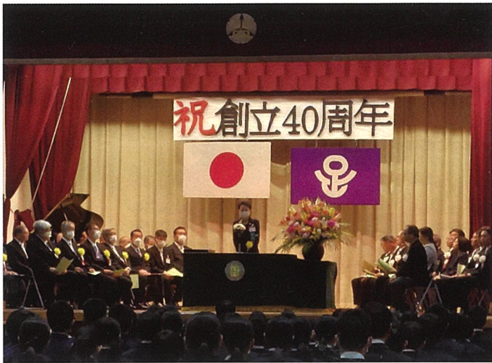
▲加賀中創立40周年記念式典であいさつする近藤やよい区長