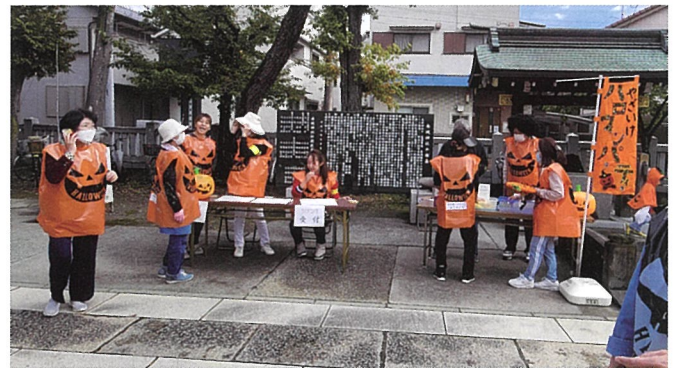
▲神社の境内でプレゼント、カレーライス、豚汁と盛り上がった

仮装した子ども達は10か所の家を廻り、お菓子のプレゼントを受け取りました。パレードも無事終わり、お昼にはスタッフが用意をしたカレーライスと豚汁を食