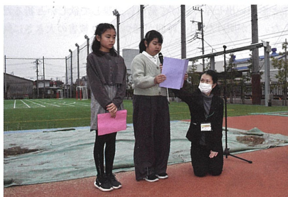
▲この「しだれ梅」を守り、育てていきますと児童代表のお礼のごあいさつ