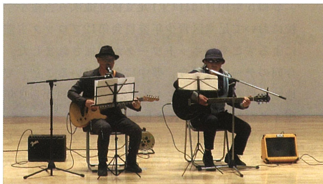
▲どこかで見た顔、あっ！校長先生だ……