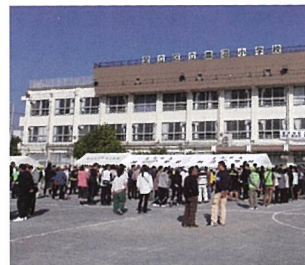
▲会場の多くの参加者