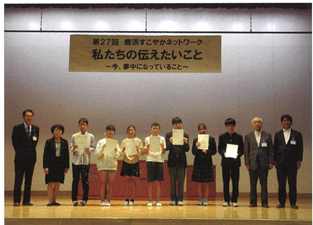
▲若くて熱いメッセージで盛り上がったすこやかネットワーク

どの発表もそれぞれの夢や趣味、スポーツなど夢中になっている若くて熱いメッセージでした。発表