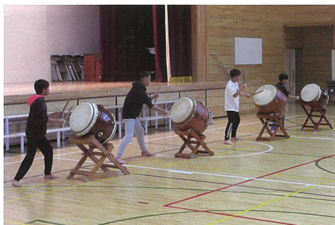
▲勇壮な太鼓の音にシビれた……（和太鼓ダチョウ）