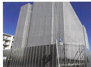
鹿浜五丁目団地、 建て替え工事中▶