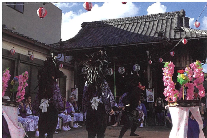
▲鹿浜東町会の社殿前で舞う獅子舞