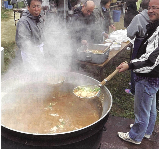
▲皿沼町会の芋煮会

コロナ禍が明け、各地区で待ってましたとばかり、芋煮会や餅つきのイベントがありました。