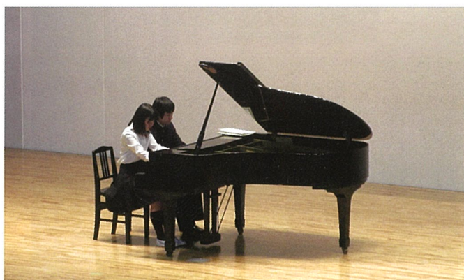
▲ピアノの美しい響きに魅了された

音楽は私たちの生活に密着したものがあり、人生においても、辛い時、悲しい時、嬉しい時、心を慰め、励まし、癒してくれたり、勇気を与えてくれます。足立区を音楽の街にしたいと言った教育長さんがいましたが、合同音楽会は多くの地域の人々が楽しみにしている行事の一つであり閉じるわけにはいきません。来年、再来年へと更なる発展をしていきたいと思っていますので今後共ご支援、ご協力をお願い申し上げます。