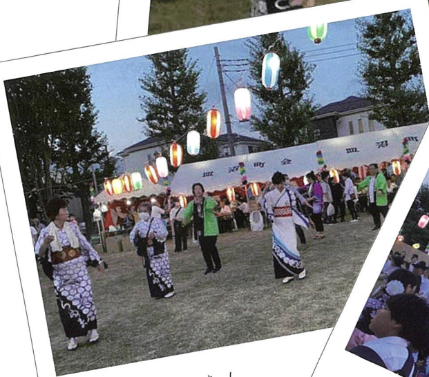
みんな待っていた！ 4年ぶりの開催