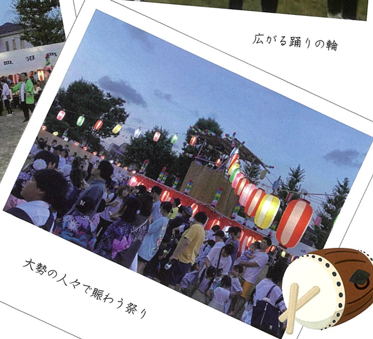
大勢の人々で賑わう祭り