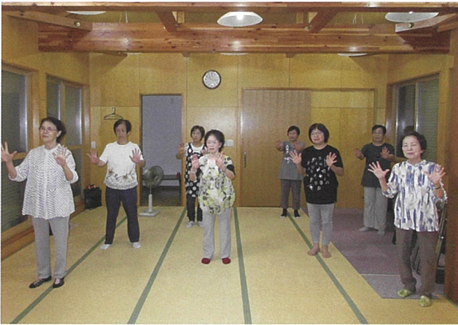
▲健康体操をするサロンつばきのみなさん