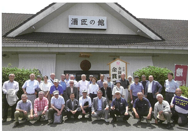
▲研修旅行へ参加した33名のみなさん