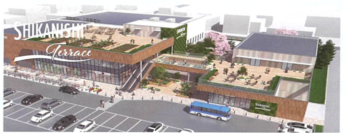
▲計画されている「鹿西テラス」の完成予想図