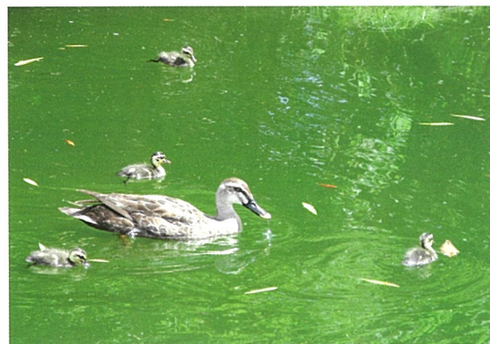
▲公園の池を泳ぐカルガモ親子