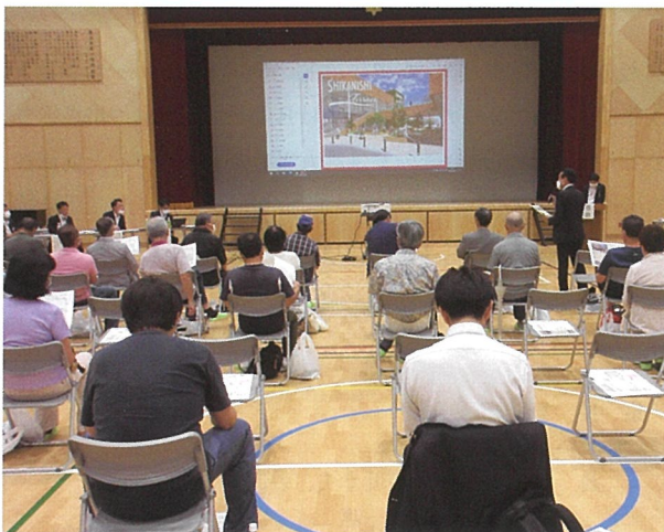
▲ベルクスによる建設計画説明会

昭和44年(1969年)4月に開校以来多くの児童を送り出した鹿浜西小学校が今年3月に閉校となりました。その後解体される跡地にはサンベルクスホールディングスの施設「鹿西テラス」が建設されることになりました。6月28日と30日に足立区とサンベルクスにより説明会がありました。