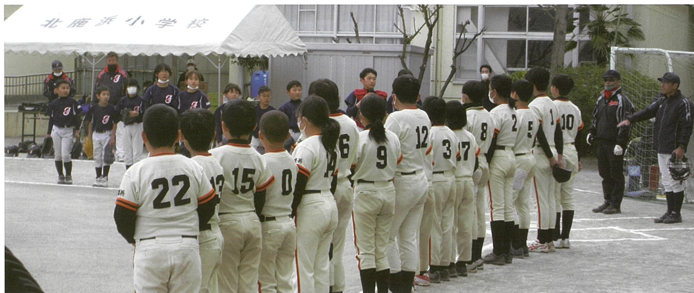
▲ガンバレ！野球少年・野球少女

令和 5 年 3 月 5 日。北鹿浜小学校に於いて鹿浜地少協、第八地少協傘下チームによる鹿浜地区対（青少年対策鹿浜地区委員会）主催の合同球技大会が行われました。鹿浜西小学校との統合により 3 月末に閉校となる北鹿浜小学校。思い出多い校庭・体育館を使用する地域団体の育成イベントとしては最後のものとなりました。