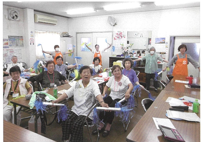
▲健康体操をするサロンいろりのみなさん