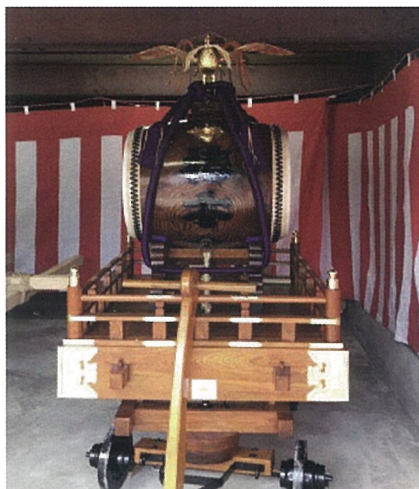
▲修繕してきれいになった山車