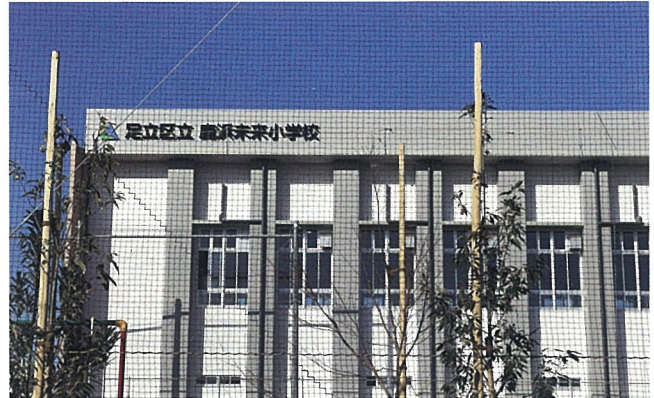
▲完成間近の鹿浜未来小学校