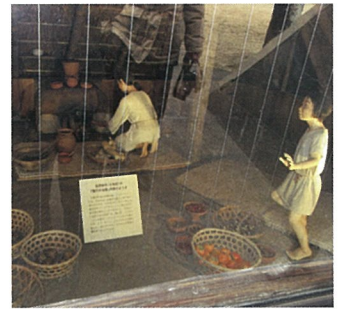
▲住居の中の古代人の生活を再現