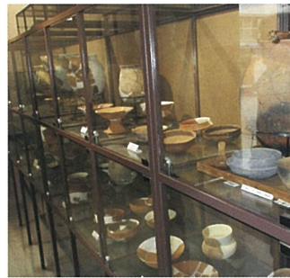
▲復元された土器の展示