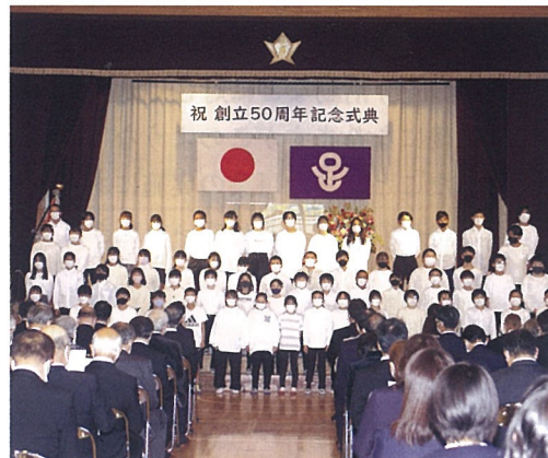
▲5・6年生の児童によるお祝いの歌