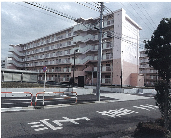
▲新しく建て替えられた団地

江北七丁目にある団地上沼田第三アパートですが、建て替え計画が進み、このたび新しく1号棟・4号棟東・4号棟西・5号棟が完成しました。