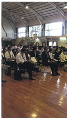
▲保護者をはじめとする聴衆