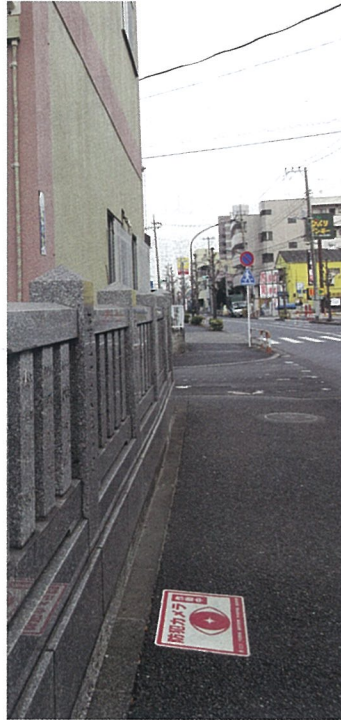
▲防犯カメラ設置を知らせるステッカー