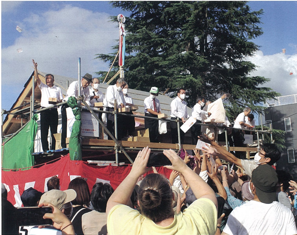
▲押部八幡神社上棟式。「わが家にも福を分けてくださいーい」と手を伸ばす氏子の皆さん