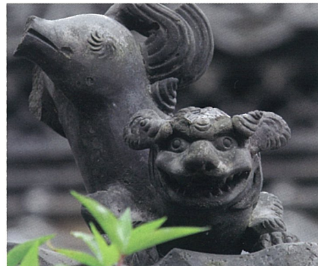
◀旧社殿の鬼がわら。恐いばかりでなく、愛嬌のある表情で長い間、押部町会を守っていただきご苦労さまでした