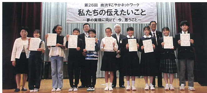
▲発表した児童・生徒のみなさん

子どもたちの将来の夢に向けたまっすぐな発表を聞いていると、我々大人たちも励まされる思いがしました。