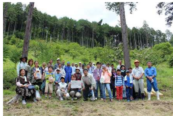
参加者と協力いただいた鹿沼市のみなさん