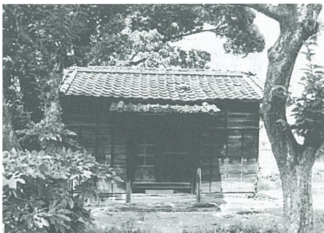
天保年間に建てられた、川口市里の船津家の裏庭にあった文庫蔵(平成23年4月解体)

里の船津家は、鳩ヶ谷宿本陣船戸家の分家であり、同じ鳩ヶ谷宿本陣船戸家の分家である江北の船津家を継いだ船津静作は安政五年(一八五八)この家で、里船津家七代目船戸徳助の次男として生まれている。 里の船津家は元禄年間に鳩ヶ谷宿本陣船戸家の四代目船戸久兵衛の末子が分家したものであり、江北の船津家もこの本陣四代目のときに分家している。 里の船津家の母屋は分家した