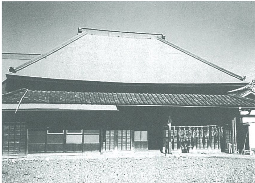
元禄年間に建てられた、川口市里の船津家母屋 船津静作は安政5年(1858)4月、この家で里の船津家7代目の船戸徳助の次男として生まれた。 平成23年4月、区画整理のため解体された。

もくじ 柏屋・星野家に伝わる三件の古文書について・上 1P はい、文化財係です。3 3P 小右衛門町の家族写真2 4P