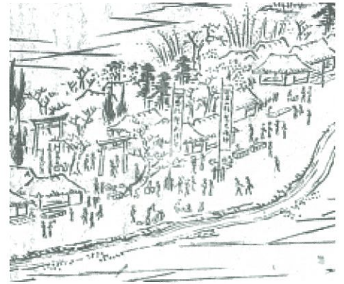
「江戸名所図会」 大鷲神社 (部分)