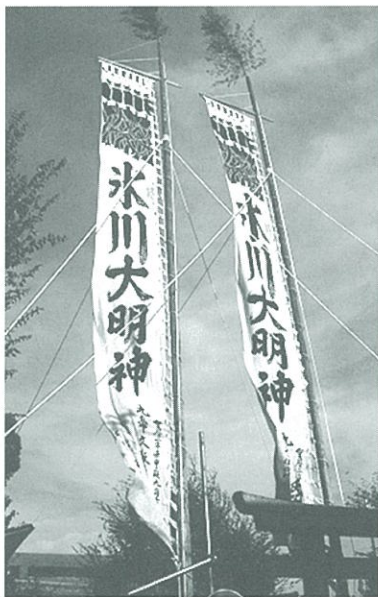
千住四丁目氷川神社の大幟 心棒の長さは25メートルに及ぶ。その昔は、浅草からも見たという。

特別に大きなのぼりを調製し、祭礼に立てるといえるのは、その土地の人々の祭りにおける心意気を示すもので、江戸中期以降、近郊農村として足立区周辺農村が経済力をもつたことよって作ることができるようになったものと考えられます。