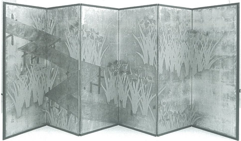
村越向栄《八橋図屏風》六曲一隻 紙本銀地着色 若田家蔵、当館寄託

■向栄の家 向栄の家は、現在の千住仲町公園(足立区千住仲町二八番)の東側部分にあった。道をはさんで向かいの千住仲町氷川神社は、年に二回、向栄を中心とした美術展覧会「千住与楽会」の会場だったところである(「千住の琳派」)。畳屋太右衛門家までは道なりに二七〇m、直