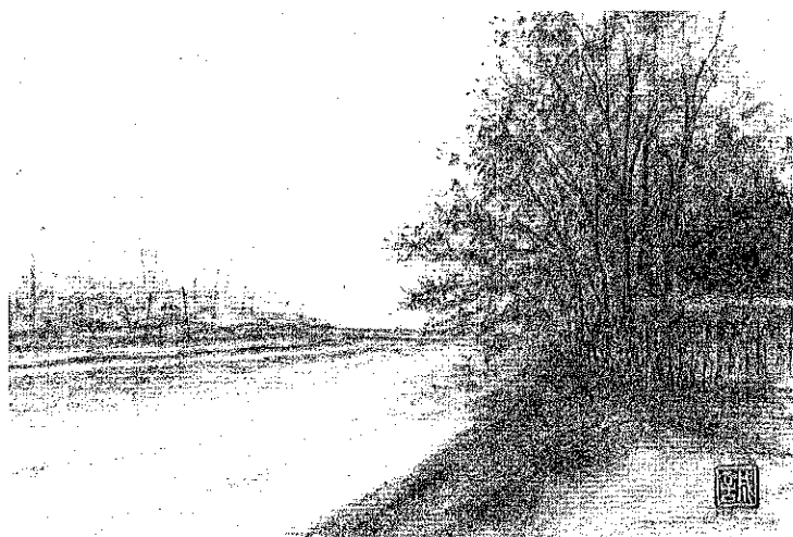
運河の風景 現在の領家橋付近まで完成していた新芝川の一部。 現在の東領家五丁目付近から東領家三丁目を望む。

■運河の風景 杉角材の橋を渡ると 埼玉県、乾いた畑ばかりが広がる。 ヒバリが青空高く舞い羽ばたき囀っ ている。大きな群れになったスズメ が、わがもの顔に飛び回っている。 ばたばた皆で駆け出すと、低い草む らから、大型の殿様バッタが一緒に 飛び出してくる。格好良いなあ！つ