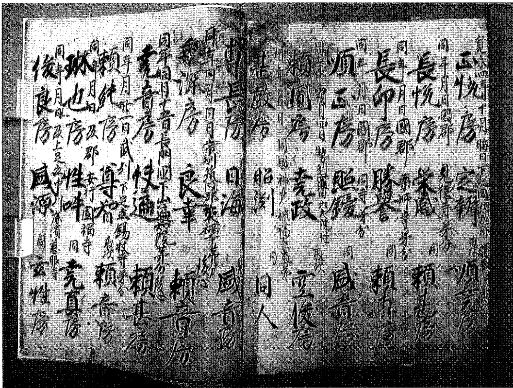
『学侶交衆帳』(奈良・総本山長谷寺所蔵)