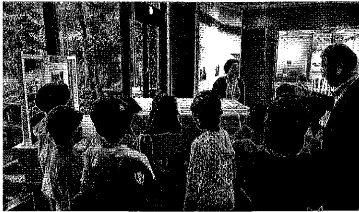
南京締めに挑戦する栗原小学校の児童たち

開催中の「あだち物流のひみつ」展では、物流産業が盛んな足立区らしさから、運送業を営んでいた方、商店でオート三輪を使っていた方をはじめ、多くの方に観覧いただいています。見学に来館の小学生たちに人気のコーナーが、「南京締め」体験コーナーです。南京締めとは荷造りのときのロープ結束の技術で、荷物をしっかりと固定できます。館内