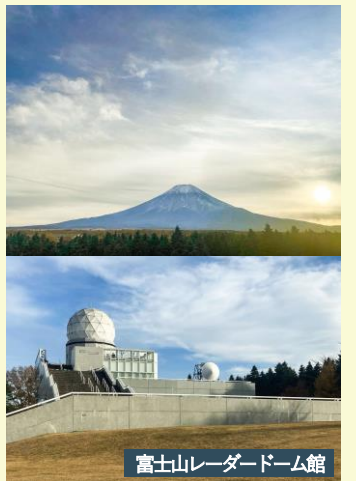
富士山レーダードーム館

コロナ禍が落ち着き、近隣の皆さんと顔を合わせる機会も増えてきた。ここ数年、中止が続いていた当町自連の事業も本格的にスタートしている。伊興地区対との合同開催である10月の大運動会も開催に向け着実に準備を進めていたが、雨天により中止。一方、11月のバス研修は写真のとおり晴天に恵まれ、雲一つ無い富士山を臨むことができた。地元の人によると数か月ぶりだとか。当町自連の幸先の良さを感じ、皆で地域を盛り上げていく思いを新たにしたい。