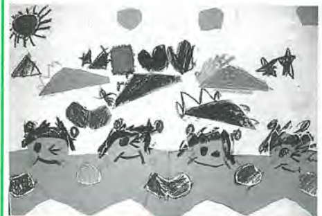
江北小1年 瀬尾文菜 作