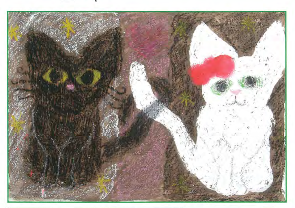
千寿常東小4年 樋口 恋 作 「黒猫と白猫」

足立区民生·児童委員協議会 中田貢弘 広 報 部 会 集 発行日 2010年11月1日 \mp 120 - 8510 足立区中央本町1-17-1 TEL 03 - 3880 - 5111