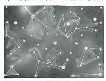
梅島第一小4年 宇田川侑香 作

その主なものは、①身体機能や判断能力が低下した 状態で福祉サービスや行政サービスを利用しようとす る場合の手続きや契約の支援、②病院や福祉施設利用 時の保証人に代わる支援、③終末期から死亡、葬儀、