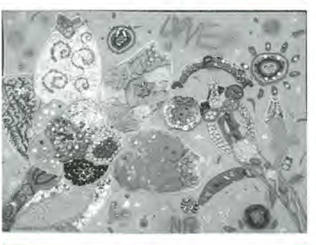
千寿第五小5年 長尾杏里 作